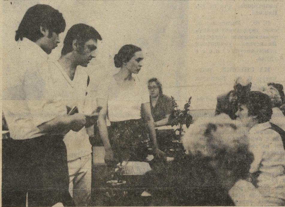
НА ИЗБИРАТЕЛЬНОМ УЧАСТКЕ ВО ДВОРЦЕ КУЛЬТУРЫ СТРОИТЕЛЕЙ ИМ. М. ГОРЬКОГО 20 ИЮНЯ 1982 ГОДА.