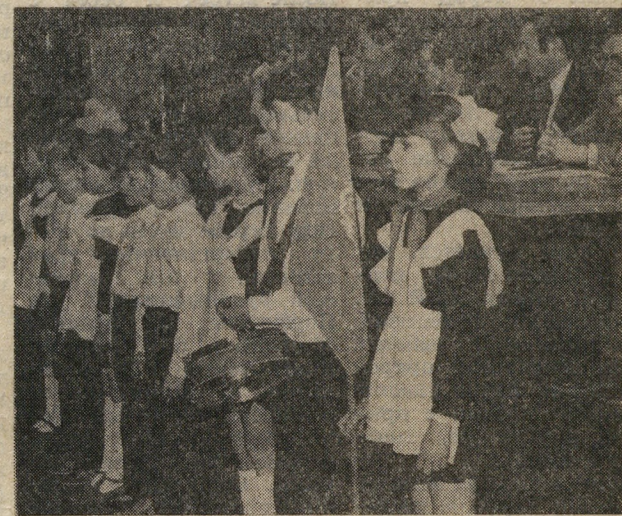
Нам скорей бы подрасти, Новый город у Палаток, Чтобы город возвести, — Под названьем МЖК!

Считать одной из основных задач КМСО МЖК — участие в реализации социального — экономической программы МЖК.