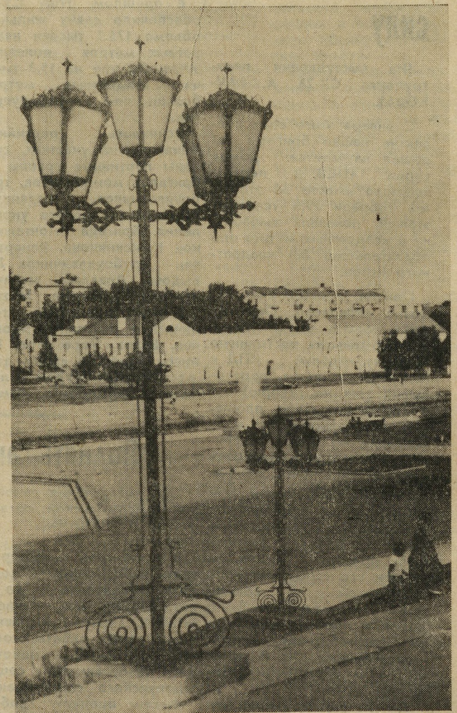
В Историческом сквере Свердловска.

Путевки на турбазу можно приобрести в бюро реализации туристско-экскурсионных путевок. Телефон — 51-33-33.