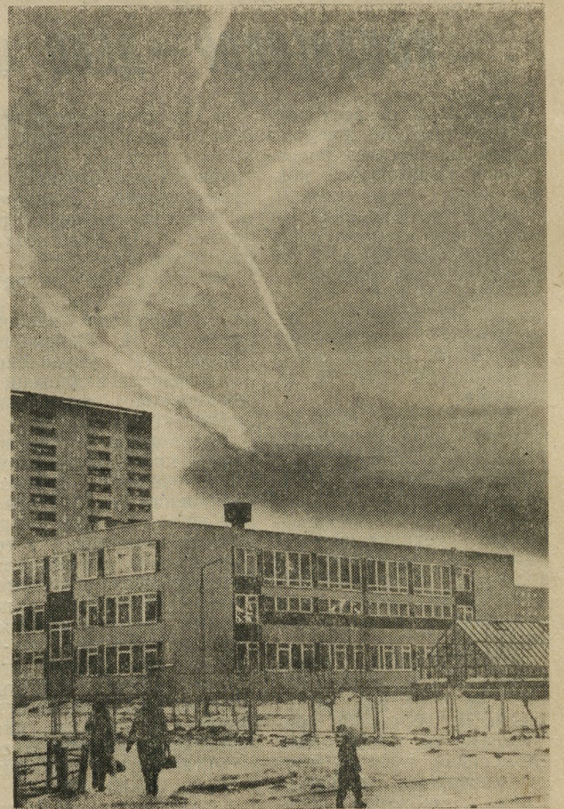
В новом микрорайоне.