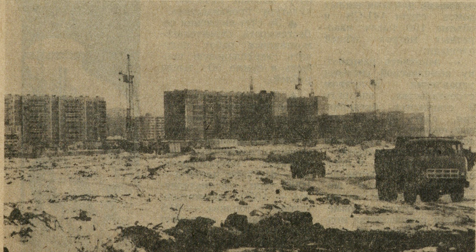
В нынешнем году главным местом застройки является микрорайон «Комсомольский». На снимке: панорама этого микрорайона.

В комбинате разработаны мероприятия по внедрению новой техники, механизации и организации производства. Их реализация позволит коллективу справиться с принятыми обязательствами, повысить качество и готовность домов к заселению.