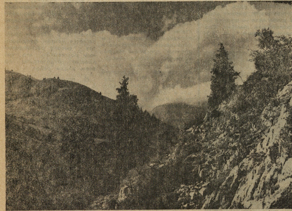
На Северном Урале.