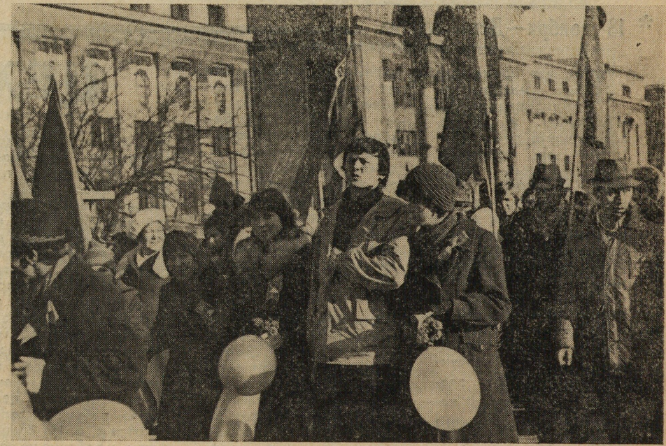
Праздничное настроение, веселье, улыбки и песни — все это можно было увидеть в солнечный день в колонне демонстрантов — трудящихся нашего комбината.