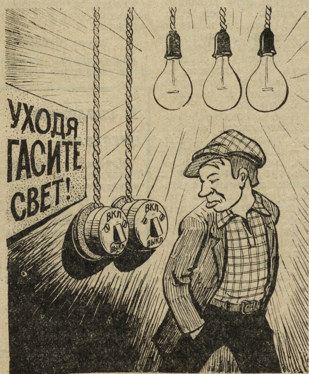
— Включал-то не я.