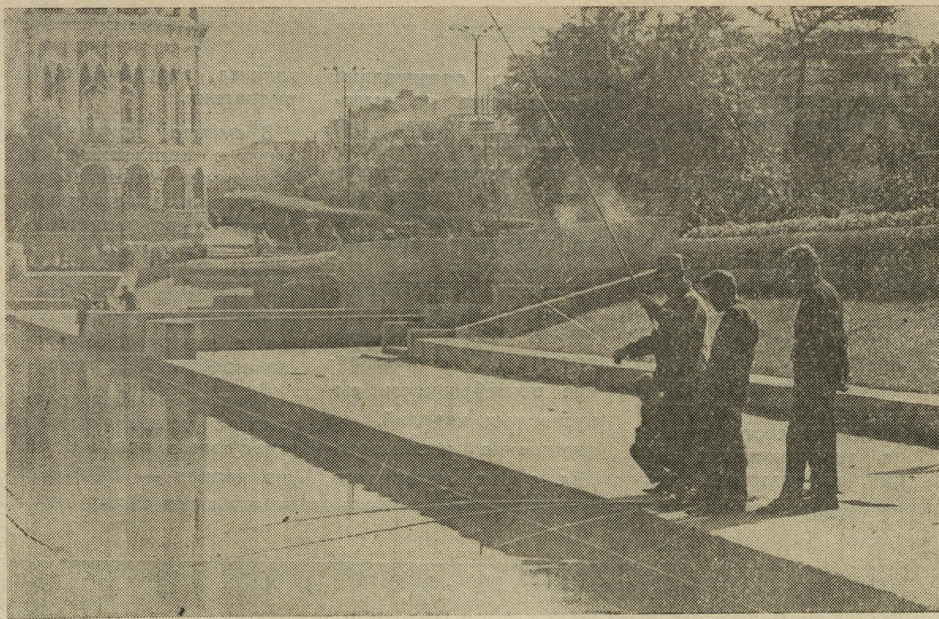
НА ГОРОДСКОМ ПРУДУ.