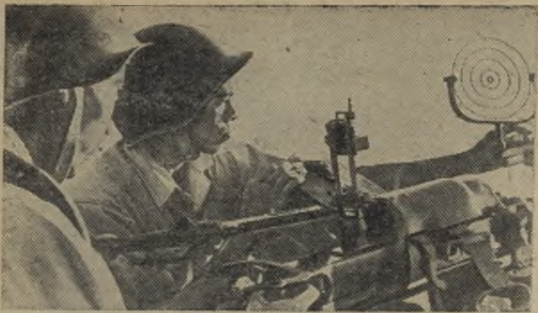
Доблестные вьетнамские зенитчики готовы вступить в бой с американскими воздушными пиратами.