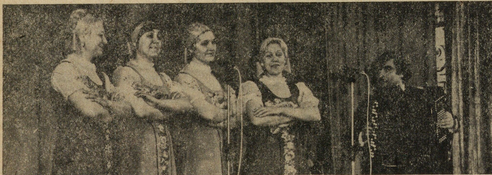
На сцене — участники смотра художественной самодеятельности.

Текст: И врага ненавистного Крепче бьет паренек За Советскую Родину, За родной огонек. М. ИСАКОВСКИЙ.