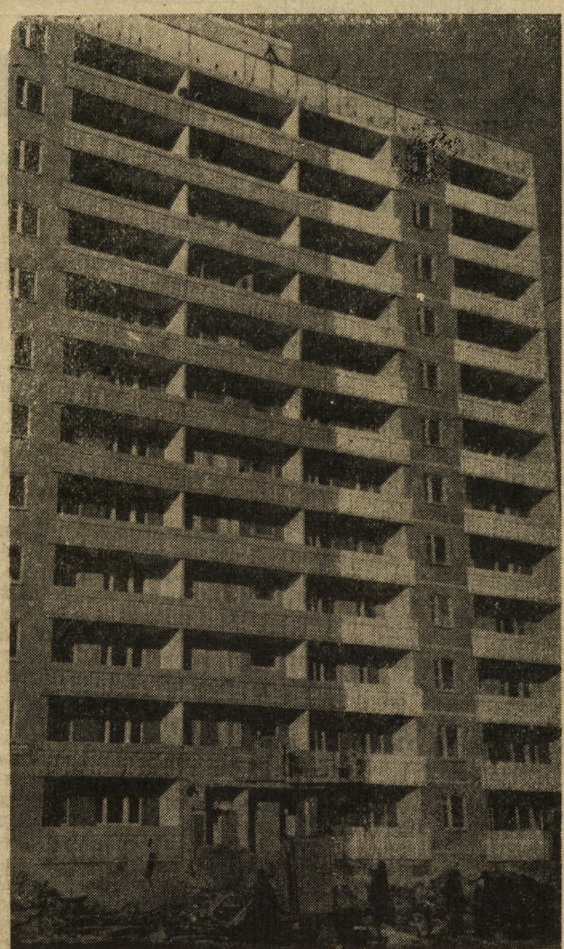
12-этажный дом в квартале Комсомольский.