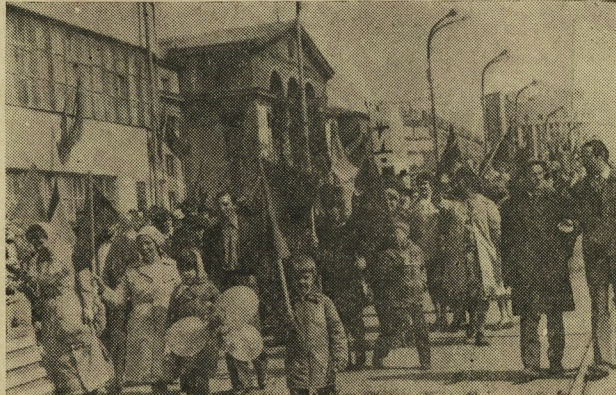
Фото В. Калимасова.

НА СНИМКАХ: идет колонна Свердловского домостроительного комбината.