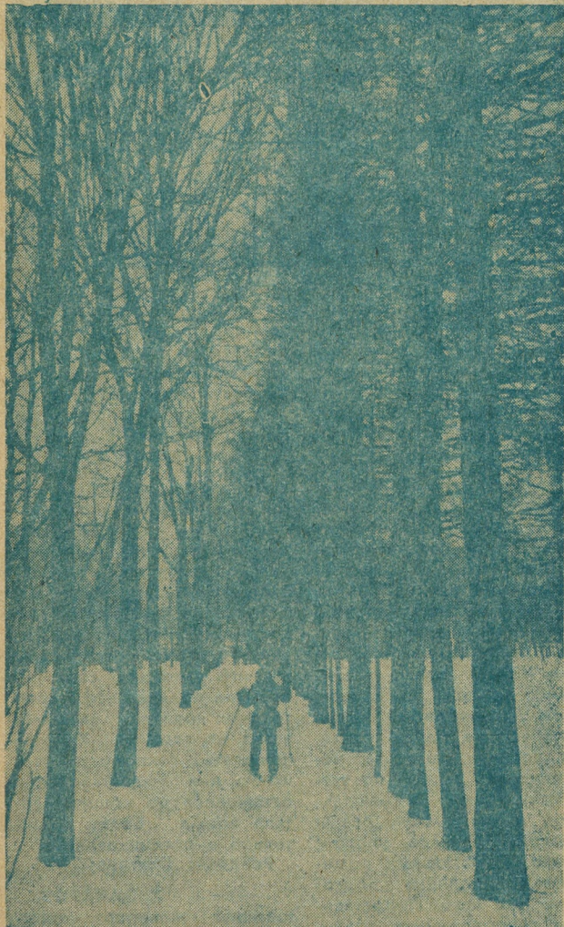
Первые шаги к рекордам.