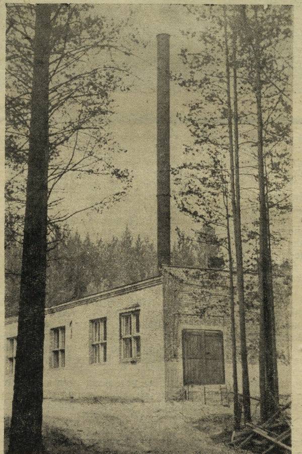
В пионерском лагере им. Ю. А. Гагарина вступила в строй котельная с системой отопления. Тепло пришло в жилые корпуса. Это даст возможность в зимнее время использовать лагерь как базу отдыха для трудящихся домостроительного комбината.