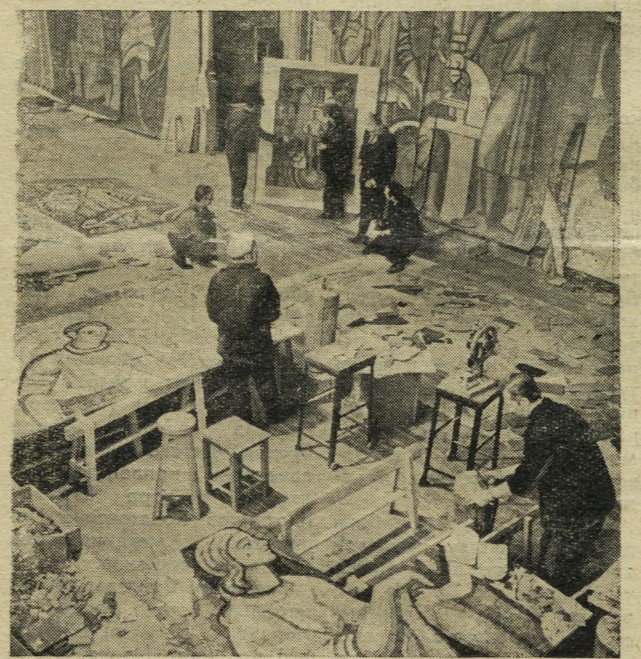
Знаменитые фонтаны «Камennyй цветок» и «Колос» на ВДНХ, мозаика Кремлевского Дворца съездов и многие другие работы выполнены в мастерской мозаики, созданной при Академии художеств в Ленинграде.