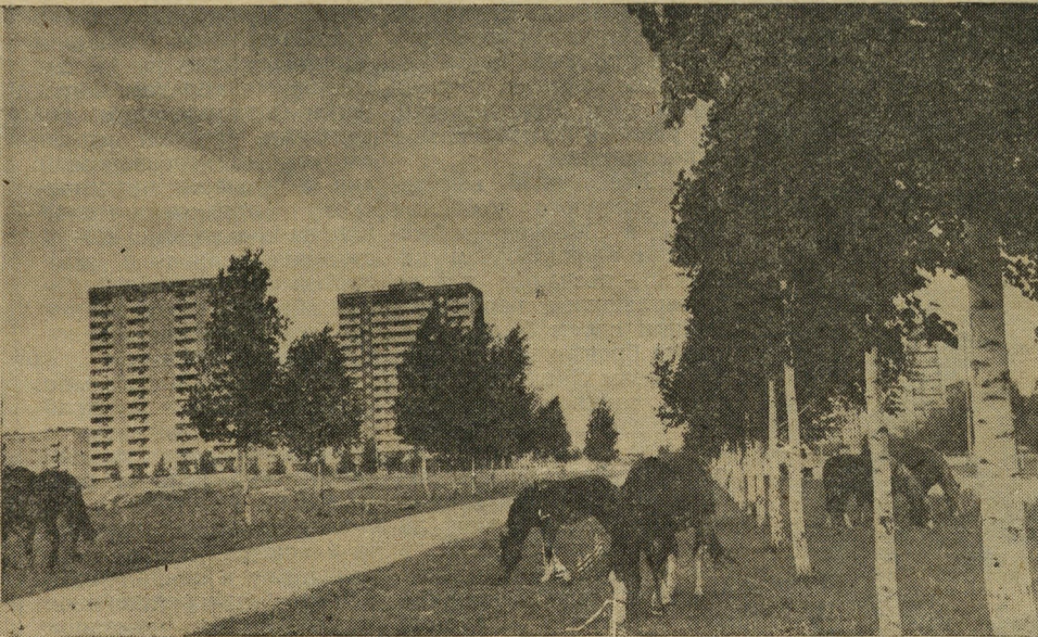
На окраине города.