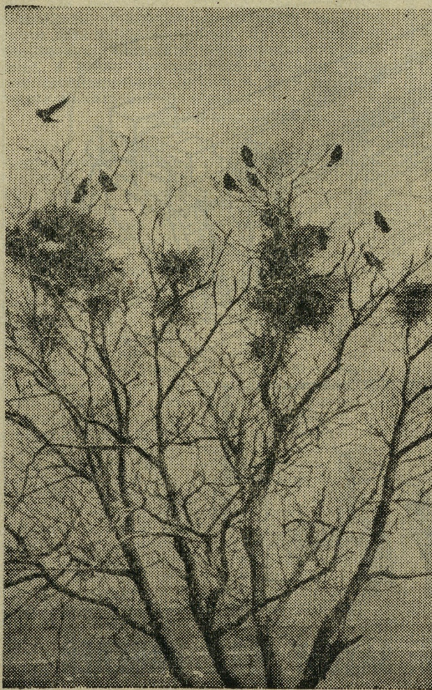
Весенние хлопоты. Фотоэтиюд В. Калимасова.

Изготовить скворечник или синичник не так уж сложно. Для их постройки берут сухие доски или горбыль толщиной от 1,5 до 2,5 сантиметра. Строгать доски изнутри не следует, да и снаружи обязательно. Однако, если придется изготавливать гнездовье уже из строганых досок, то на внутренней стороне передней стенки надо обязательно наделать стамеской насечки. Птицы и птенцы будут по ним выбираться наружу.