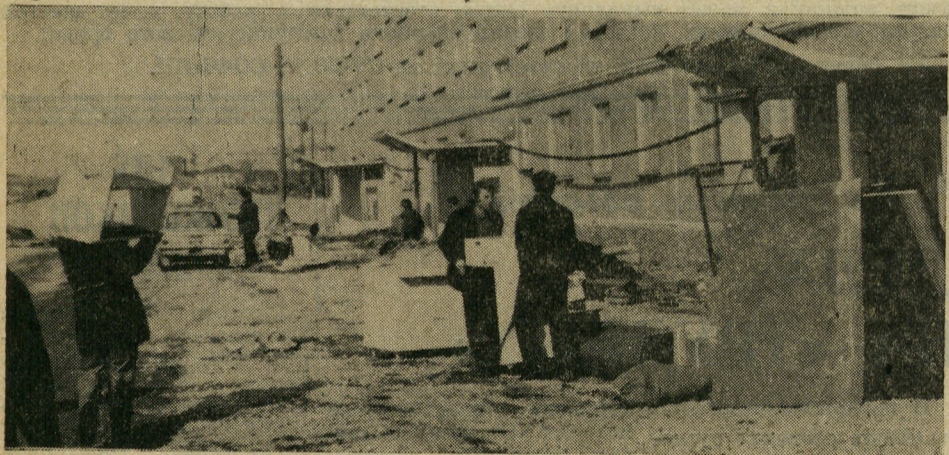
Еще двести пятнадцать семей строителей и заводчан смогут справиться новоселье в девятиэтажном доме по улице Панельной в районе Комсомольский. На снимке: первые новоселы.

Формирование политической культуры у трудящихся — важная задача партийных организаций, осуществляющих комплексный подход к воспитанию.