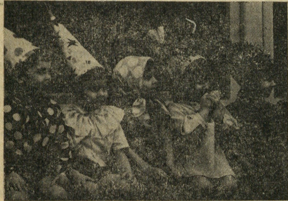
Фото и текст В. Калимасова.

Дед Мороз ничуть не отставал от ребят. Вместе с ними бегал и играл возле елки, шутил и смеялся. Своим волшебным посохом он мог любого непослушного заморозить, а грустного развеселить, зажечь елку и подарить рассказчику конфетку или игрушку.