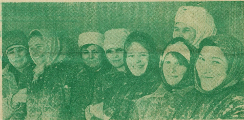
* Новогоднее интервью