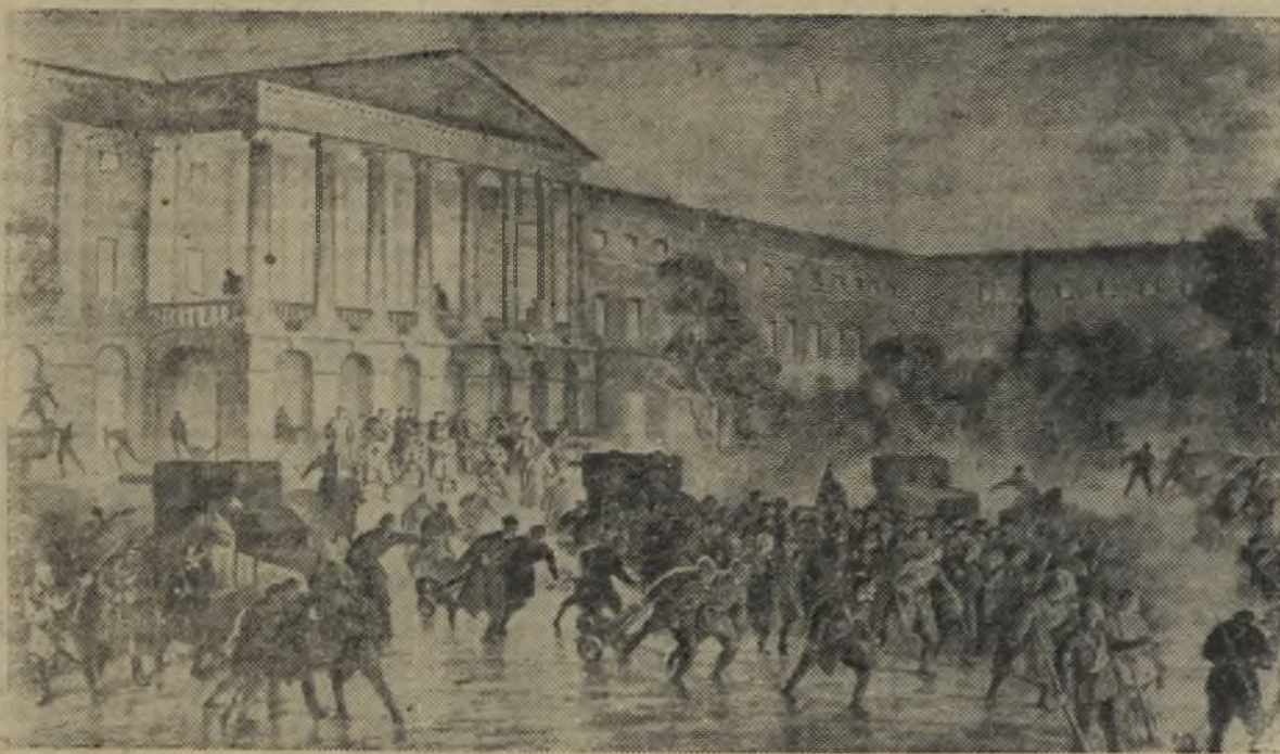
Фрагмент картины художника В. А. Кузнецова «Смолярный в Октябрьские дни».