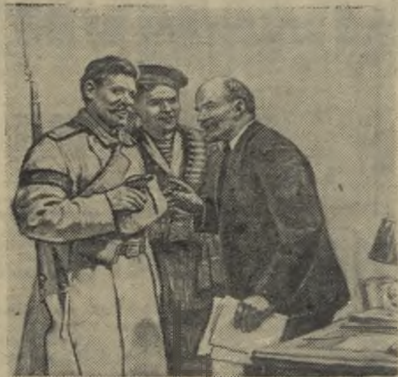
В. И. Ленин беседует с красногвардейцем в Смольном.

Поздно вечером в тот же день Владимир Ильич прибыл в Смольный, чтобы непосредственно руководить восстанием.