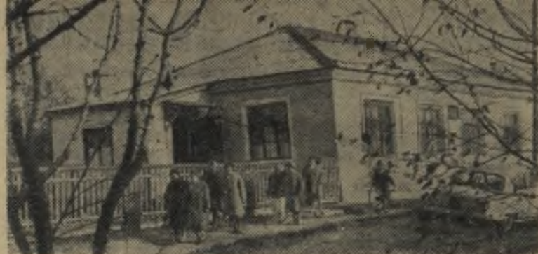
Краснодарский край. Усть-Лабинская контрольно-семенная лаборатория — одна из самых крупных на Северном Кавказе. Она обслуживает около 30 хозяйств.

Руководителям совхоза следует в ближайшие дни сделать все возможное, чтобы устранить эти недостатки.