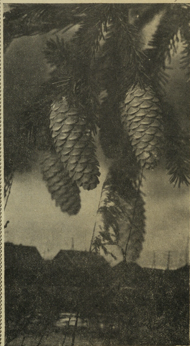
Январь — середина зимы. Прошел день зимнего солнцестояния, и чуть дольше стало задерживаться на небе наше светило.

Нынешняя зима выдалась на редкость теплой. Лишь в декабре глубокие снега укутали землю, намели сугробы ветра, снежные шапки накрыли молодые ели, кусты.