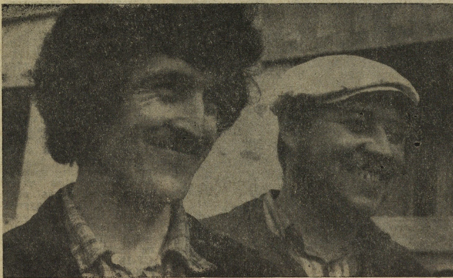
Фото и текст В. Калимасова.