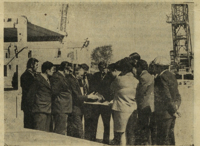
НА СНИМКАХ: первый секретарь обкома Б. Н. Ельцин в цехе завода ЖБИ и на стройплощадках ДСК.

заводе будут заменены новыми. Разрабатываются мероприятия по включению в состав бригад монтажников машинистов башенных кранов.