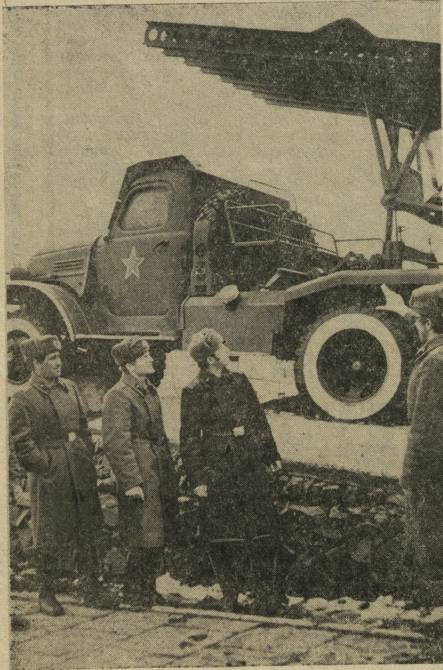
Этот танк установлен у здания краеведческого музея в бывшей монастырской роще. Боевая машина прошла большой путь, разила врага под Сталинградом. Танк был несколько раз в ремонте. На пьедестале — следующая короткая надпись: «Танк Т-34. 1941—1945 гг.» Уральские заводы выпускали тысячи этих грозных машин. Сейчас старый танк — боевая и трудовая реликвия Великой Отечественной войны. Текст и фото Е. ШАБАШОВА.

5 мая советский народ отмечает День печати. Это праздник не только профессиональных журналистов — работников газет и журналов, но и огромной армии внештатных корреспондентов — работников газет и журналов.