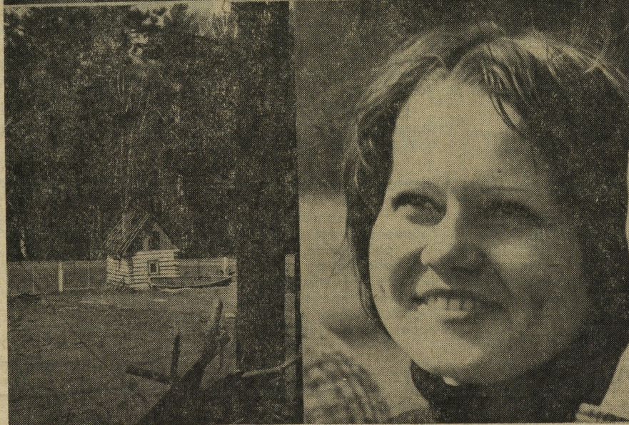
На снимках: комсомольцы на субботнике; в ребячьей республике.