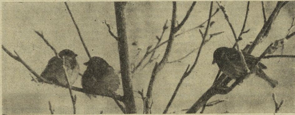
В ожидании весны.

Но что говорить о добром отношении к обитателям леса, когда кругом столько свидетельств прямо-таки варварского отношения к самой природе. Вот кто-то срубил несколько елок, выбрал одну, остальные бросил. В дру-