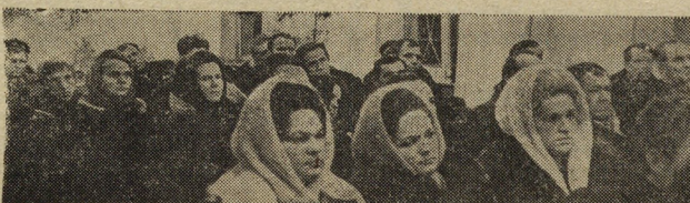
А. ЧУРКИН.

Транспортники и заводчане заинтересованы в улучшении дела. Недавно в красном уголке партбюро завода ЖБИ имени Ленин-