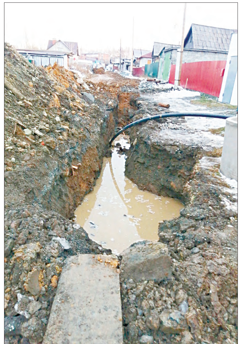
В эту траншею с водой будут укладывать трубы?