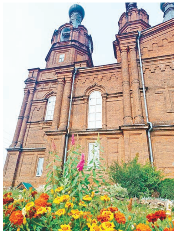
Церковь Александра Невского — историческое достояние города