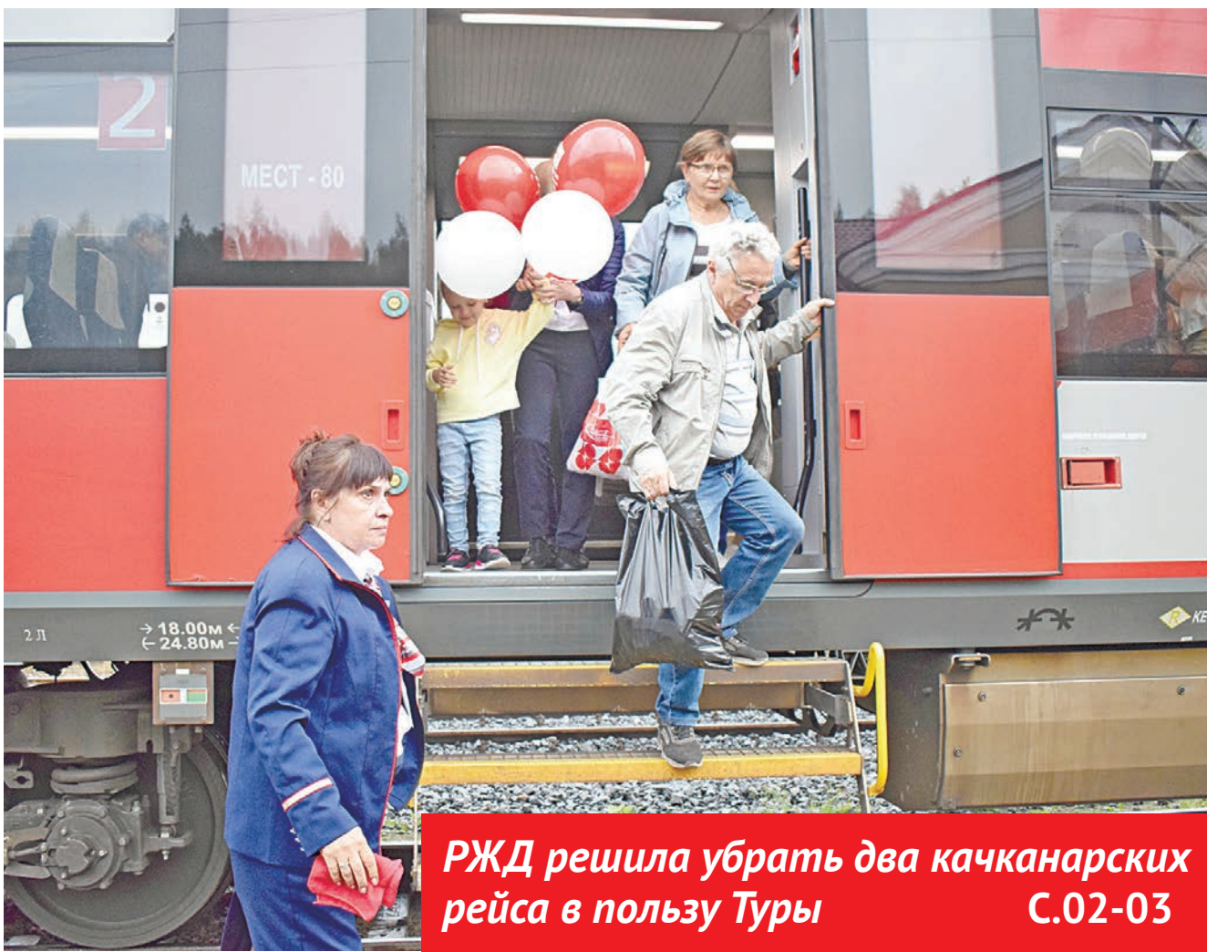
РЖД решила убрать два качканарских рейса в пользу Туры С.02-03