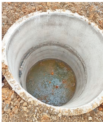
Колодец с водой не огорожен и не прикрыт

— Утрамбовывают землю экскаватором, труба или уже где-то лопнула или ещё лопнет, когда грунт сядет, — продолжает мужчина. — Колодезные кольца укладывают без смолянистого жгута, поэтому они и стоят с водой, куратора на месте работ вообще не видно было. Вся дорога завалена, люди ходят чуть не падая в траншею. Ни скорой помощи, ни пожарной машине по ней не