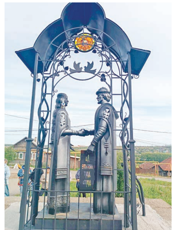
Рядом с церковью памятник Петру и Февронии

30 миллионов рублей. А всего на восстановление потребовалось 104 миллиона рублей, вот это масштабы. На набережной установили скамейки, обустроили пешеходные и велодорожки, а также лестницы для спуска к воде. Изюминки проекта — амфитеатр, пляжный комплекс со смотровой площадкой «Маяк» и плавучие беседки.