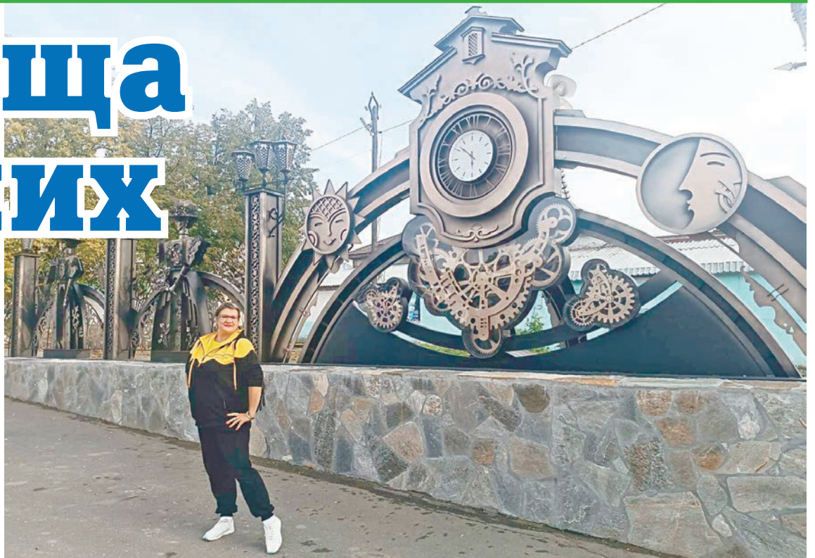
Главный арт-объект набережной — часы «Времена года»

Проект получил на благоустройство грант в размере