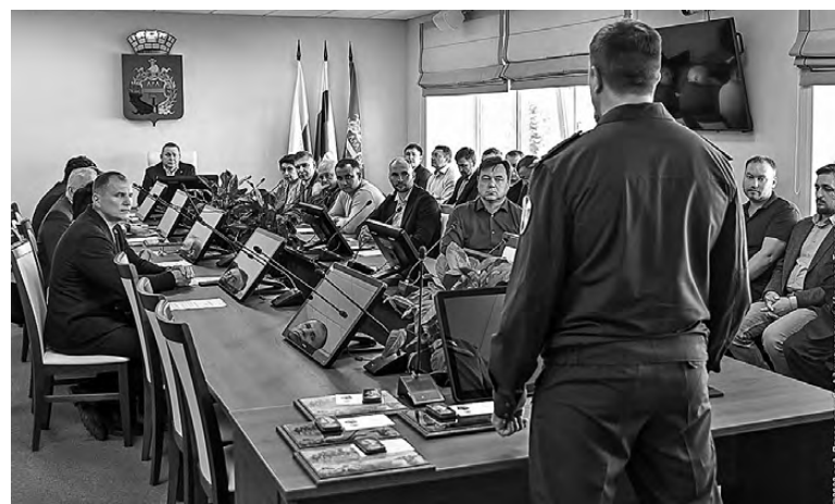
Наша задача – помочь.