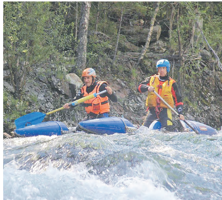
На реке Коргон на Алтае.