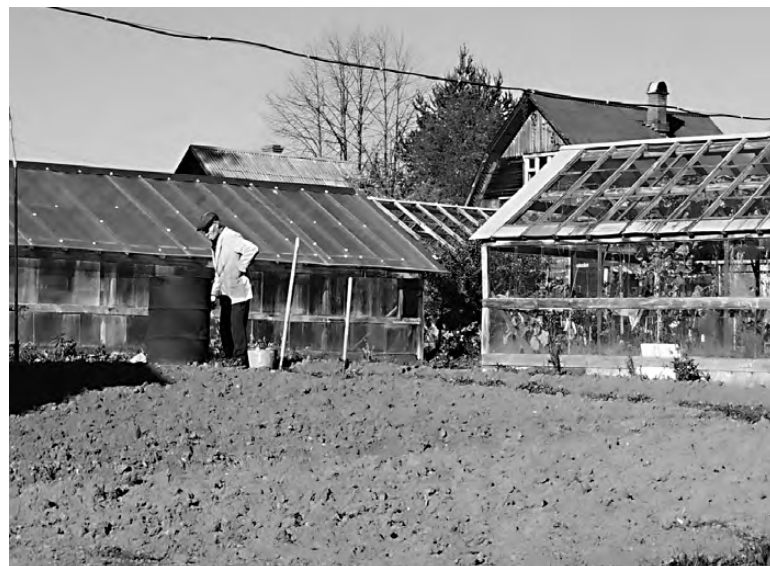
Готовимся к зиме.

Выкопайте поздние сорта картофеля, уберите свеклу. На грядках пока продолжает ра-