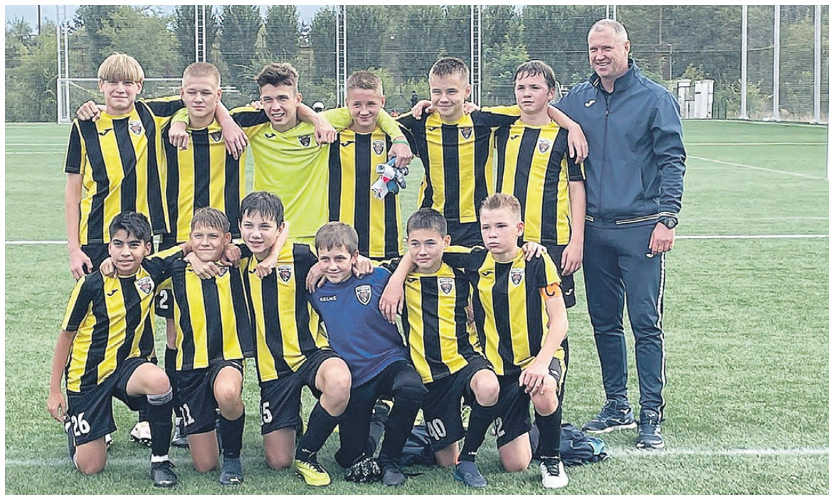
«Бронзовые» призеры соревнований «Кожаный мяч».