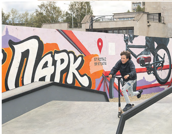
Есть, где полетать!

фий нам улыбаются люди, собравшись возле фонтана с лягушками в Пионерском сквере или у качелей-лодочек в парке металлургов... Где сегодня фотографируются гуляющие тагильчане?