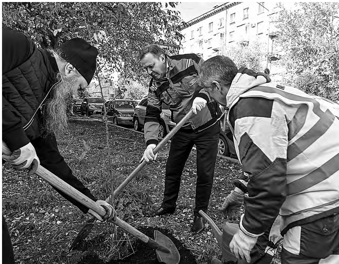
Депутаты и чиновники высадили деревья в центре города.

В начале недели центр Нижнего Тагила стал еще зеленее: члены Торгово-промышленной и Общественной палат, депутаты городской Думы и глава города высадили на проспекте Строителей 500 кустов барбариса, саженцы яблони и рябины, выращенные в тагильском Горзеленхозе. Теперь вместо погибших растений – молодые деревья и кустарники.