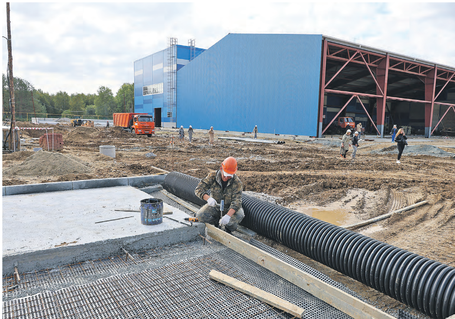
Готовность объекта оценивается в 90 процентов.

Настоящей эпопеей стало строительство жилого дома в поселке Уралец, на которое было выделено более 73 миллионов рублей. 84 жителя из этого поселка, а также из Чашино и Висимо-Уткинска, в 2020 году покинули свои ветхие бараки и переехали в благоустроенные квартиры.