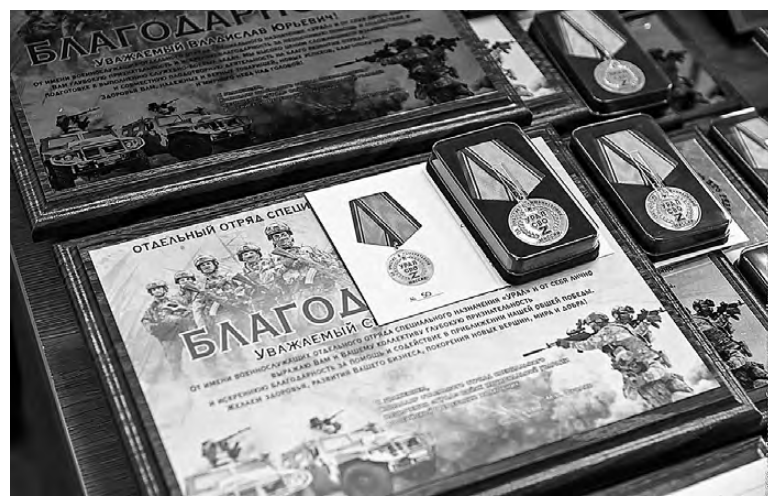
Благодарности и медали.