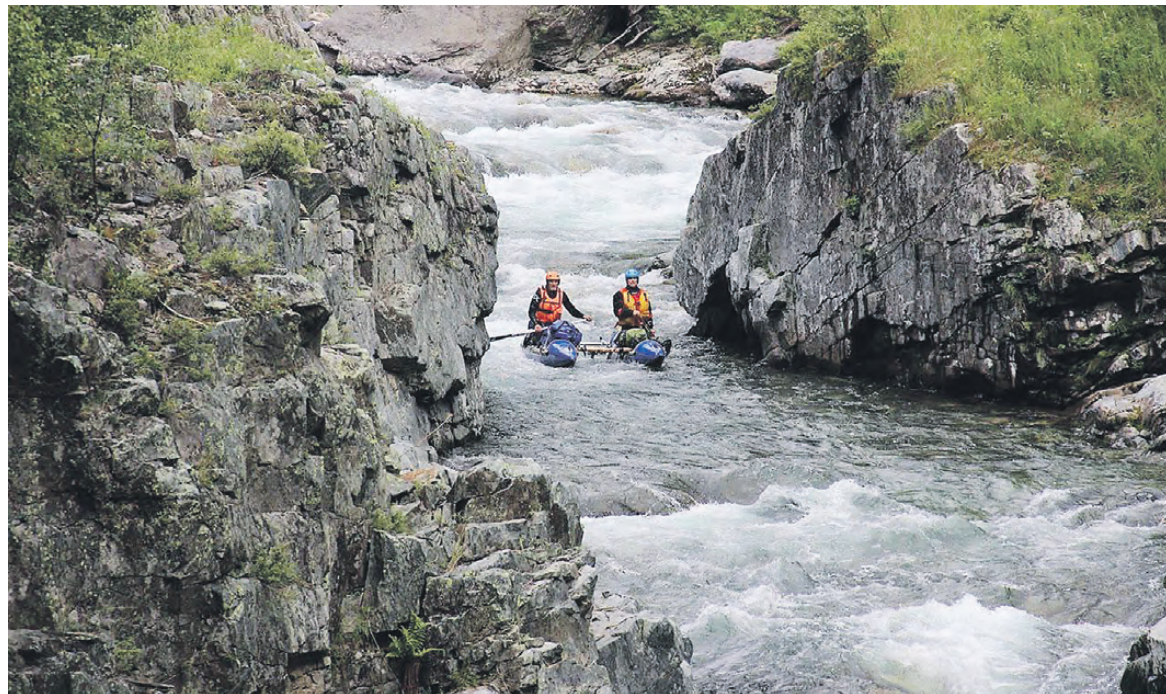
Сплав по реке Ара-Ошей в Бурятии.