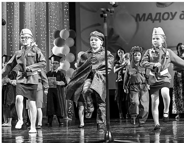
Торжество прошло во Дворце культуры имени И.В. Окунева.