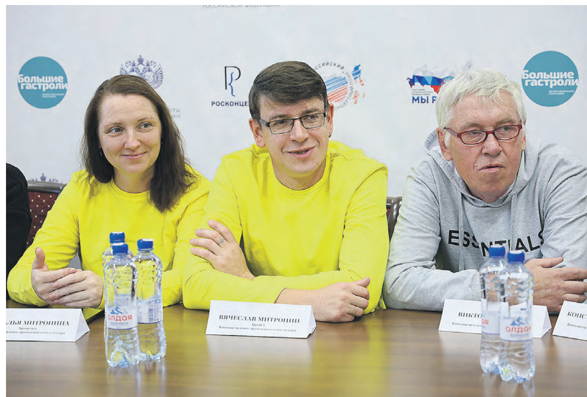
Пресс-конференция перед спектаклями.

В минувшие выходные в Нижнетагильском драматическом театре имени Д. Н. Мамина-Сибиряка гостил драматический театр имени А.Н. Островского из Кинешмы. Зрителям показали пять классических спектаклей: «На бойком месте» по пьесе А. Островского, «Светлые души» по рассказам В. Шукшина, «Пестрые рассказы» А. Чехова, сказки «Русалочка» и «Оловянный солдатик» Андерсена. Тагильские актеры в это время радовали своими постановками публику в Кинешме.