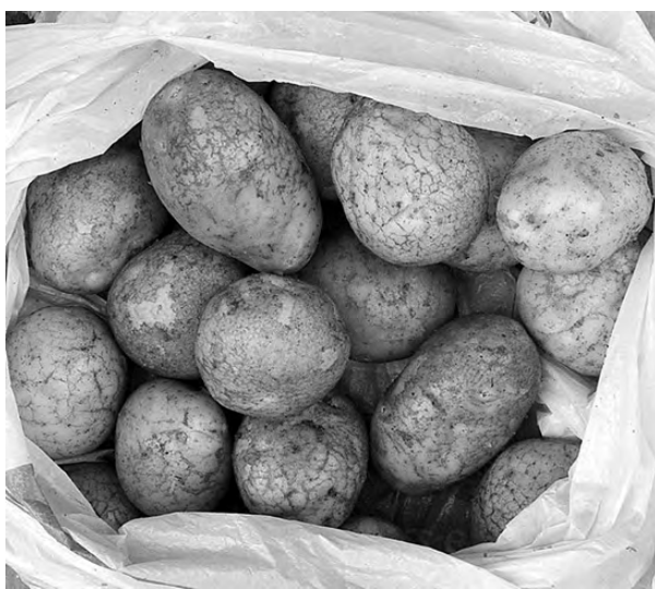
Храните картошку в сетках и в сухом помещении.

ваю семенные клубни при выкопке картофельных кустов и до апреля размещаю в хранилище. Далее проращиваю до зеленых ростков на солнце в перфорированных ящиках. С конца мая и до начала июня стартует посадка картофеля в теплую, вспаханную землю. Первая окучка (удаление сорняков) начинается, когда ростки достигают 20-30 см, а вторая, она же и последняя, – через месяц. У корнеплодов есть немного раздражающая особенность – с движением естественного роста плода он может выле-