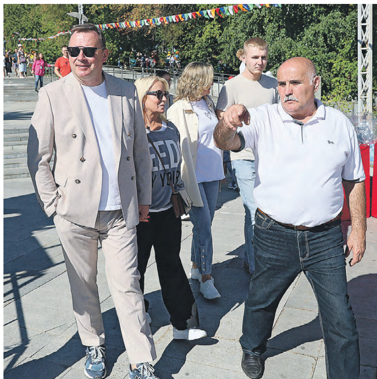
Глава города Владислав Пинаев вместе с супругой посетили «Городок веселых праздников».

В этом году Киндерград превратили в «Городок веселых праздников». Около ста сотрудников тагильских библиотек подготовили два десятка познавательно-развлекательных