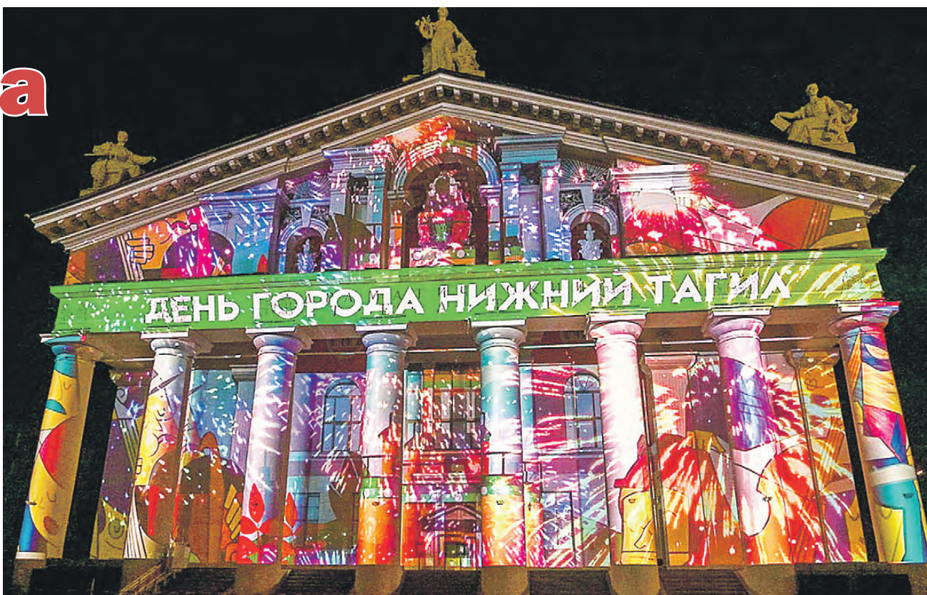
Яркая, удивительная история в пяти минутах игры света.

В прошлом году у организаторов ушло много времени на выбор здания. Остановились на драматическом театре. На это повлияли его интересная архитектура и тот факт, что на Театральной площади собирается гораздо больше людей, чем в любой другой точке города. На 13 минут зрителей окунали в 300-летнюю историю нашего города.