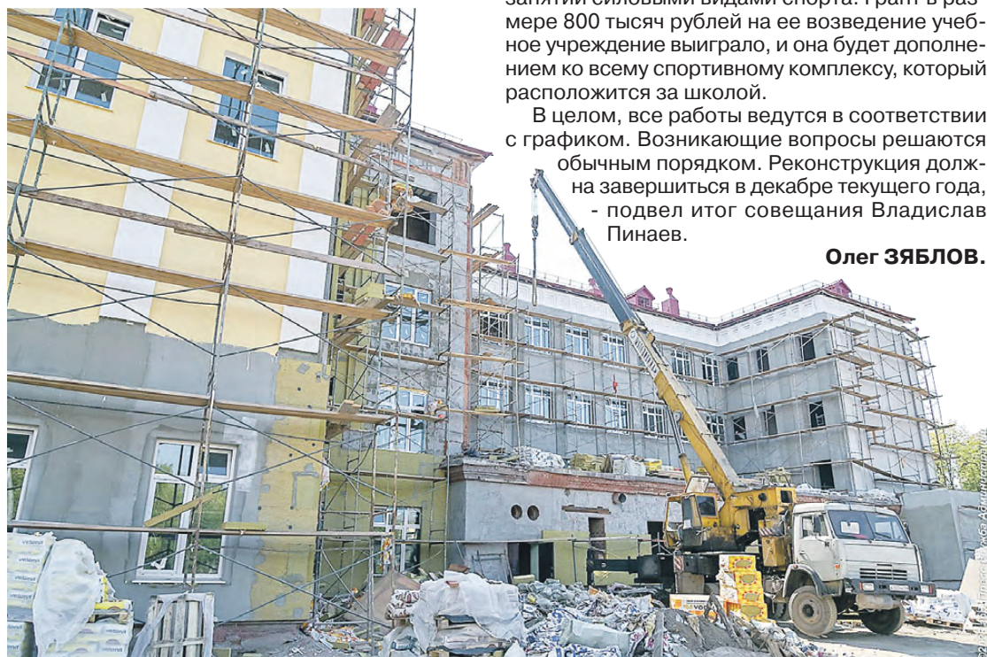
Завершаются работы по утеплению фасада.