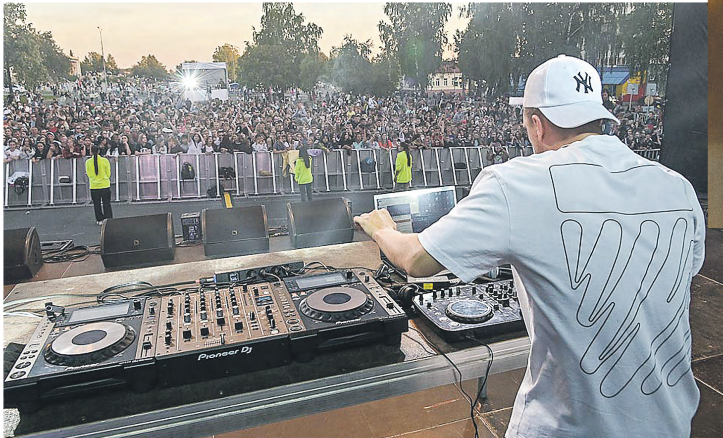
Тагильчане оценили «Молодежный движ».