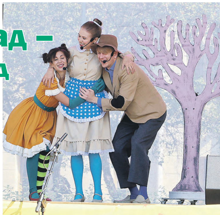
Сказки и улыбки Театрграда.

нем Тагиле позже детского городка, но тоже стал популярным у местных жителей. Разнообразная программа со спектаклями, песнями и мастер-классами дает возможность и интересные постановки посмотреть, и поделку в специальной палатке сделать, и любимых актеров увидеть вблизи, что называется, на расстоянии вытянутой руки. В