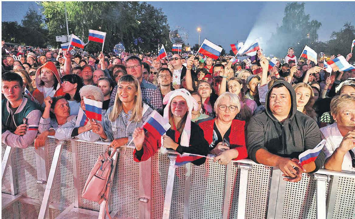
Зрители активно поддерживали любимого певца.