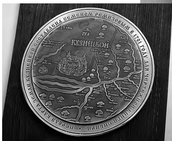
Первая карта земли Кузнецкой.