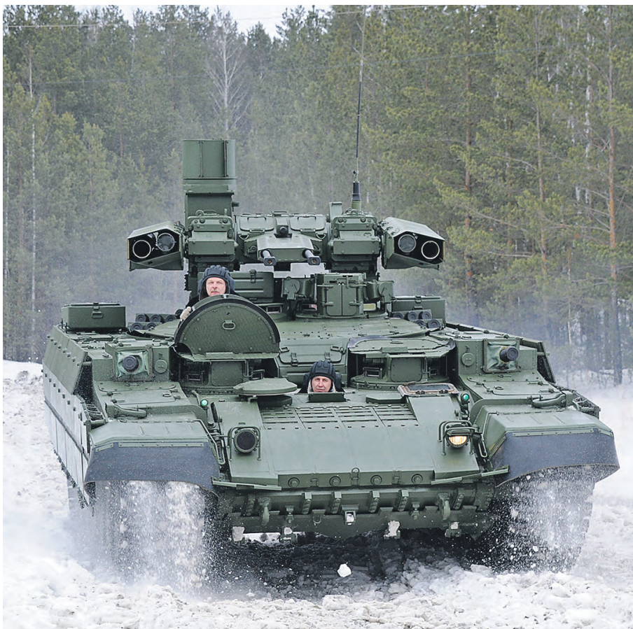
Боевая машина поддержки танков.

- Не совсем. Все-таки, боятся. Когда начинал работать в 1980 году, нормальных дорог на нашем полигоне почти не было. Весной и осенью в распутицу, в слякоть, в дождь техника едва ли не тонула в грязи. Сейчас ситуация изменилась в лучшую сторону. Мы имеем возмож-