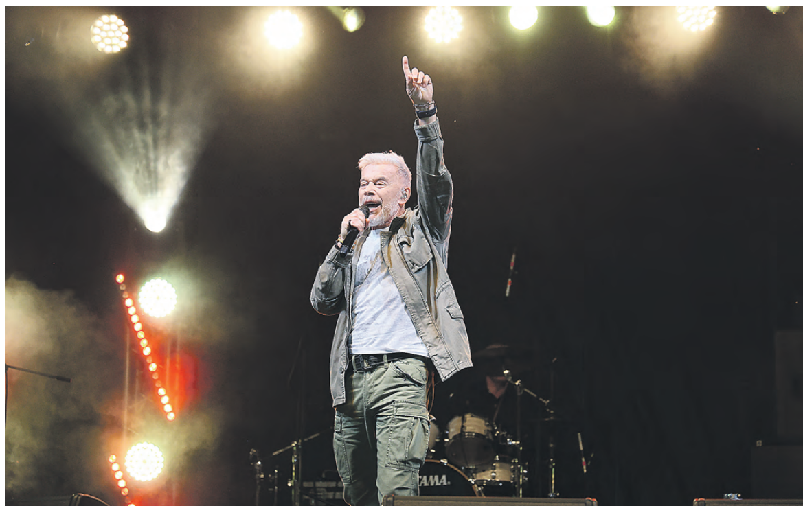
На сцене Олег Газманов.

Наиболее сильная по поэзии, по музыке - песня «Питер», но я ее редко исполняю. Недавно мне удалось ее спеть