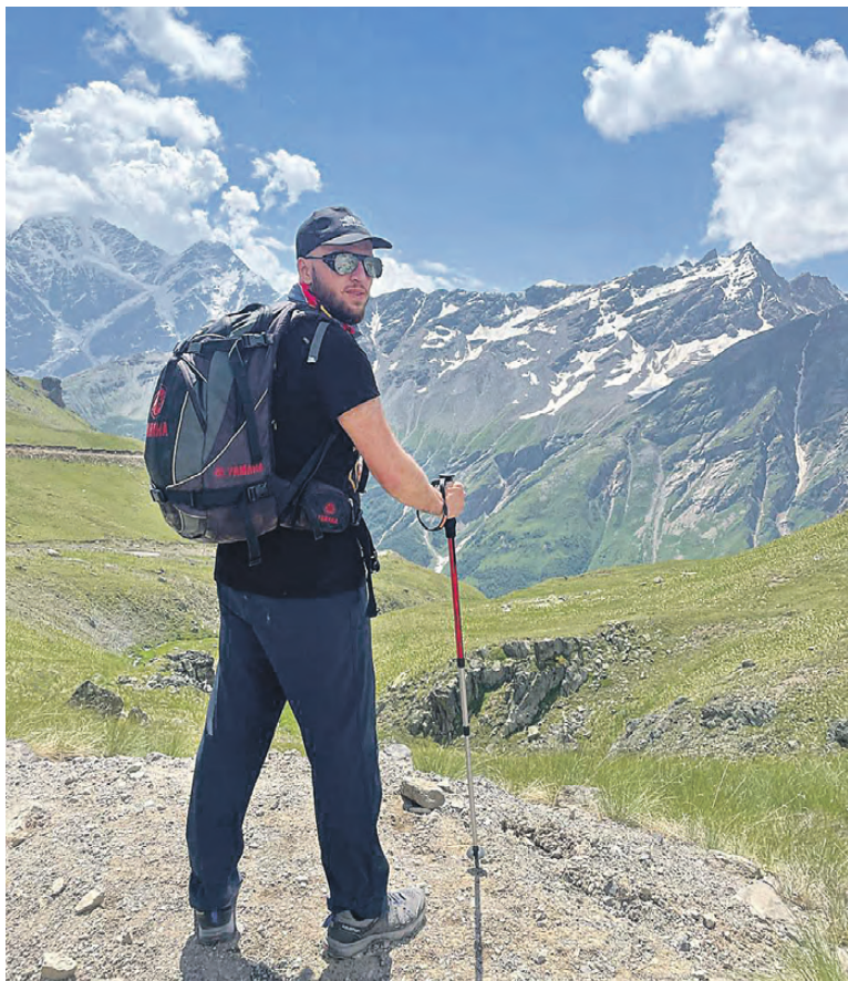
Глава семьи на Эльбрусе.