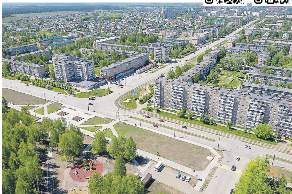
Дороги стали нашей гордостью.