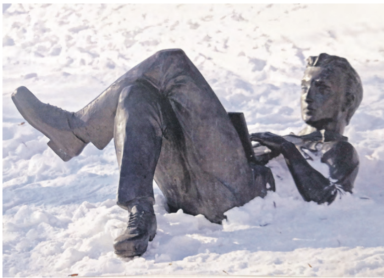
«Тагильский бездельник» Анатолия Радостева.