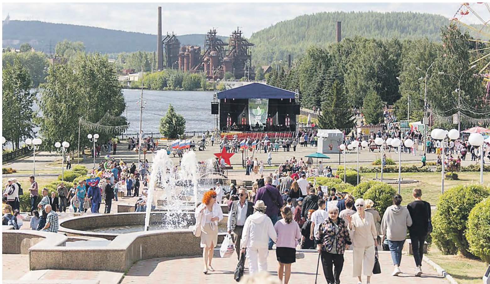
Реализация национальных проектов делает Нижний Тагил уютным, зеленым, комфортным.

Войдя в федеральную программу, приобретем новое оборудование. Пока артисты будут проводить репетиции с прежним.