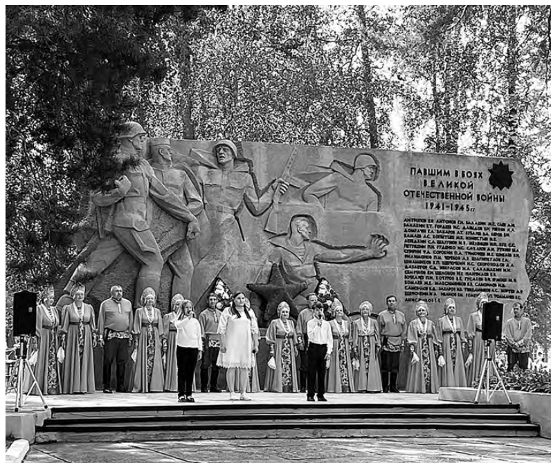
У памятника работникам полигона, погибшим на фронтах Великой Отечественной войны.