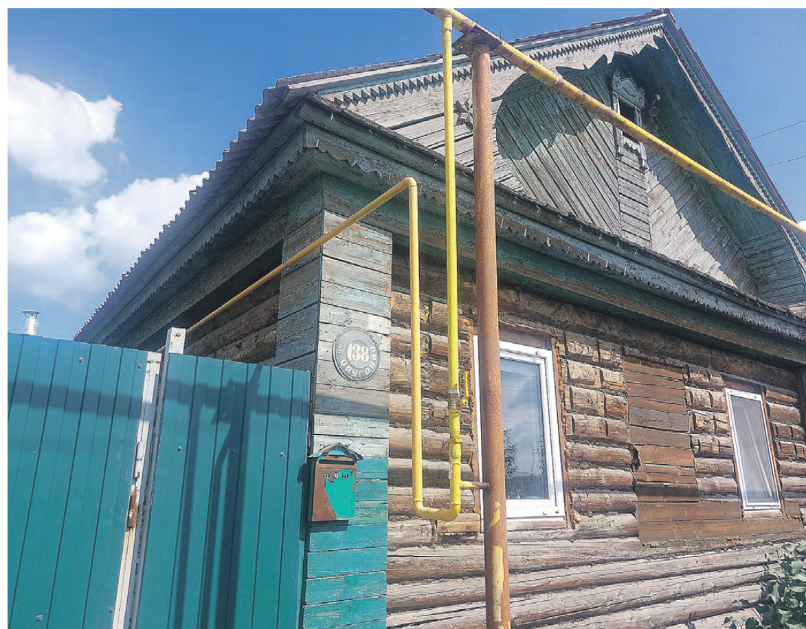
Газ уже проведен!

Напомним, Нижний Тагил стал единственным городом в Свердловской области, включенным в программу догазификации, проводящуюся в рамках национального проекта «Экология» федерального проекта «Чистый воздух».