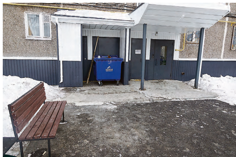
Гвардейская, 48. У подъездов все вычищено до асфальта.