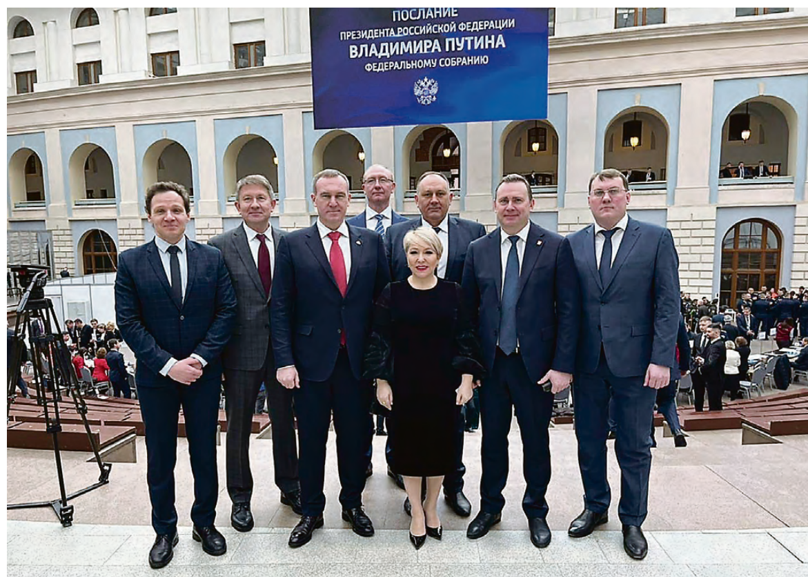
Сопредседатели ВАРМСУ и главы муниципалитетов в Гостином дворе.