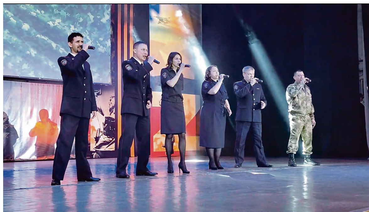
Ансамбль «Крылья Тагила».