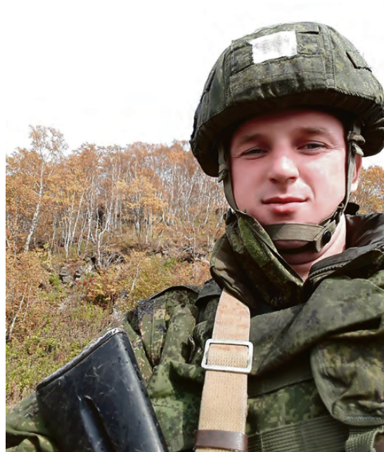
Взрослым - в морской пехоте.

Дорогие земляки, уважаемые военнослужащие и ветераны Вооруженных сил!