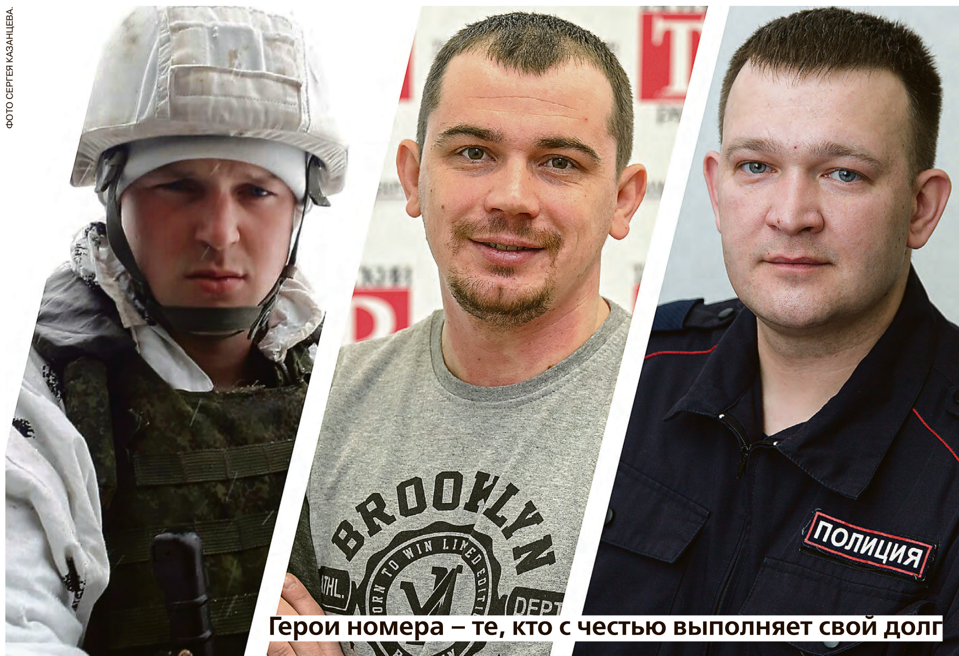
Герои номера – те, кто с честью выполняет свой долг