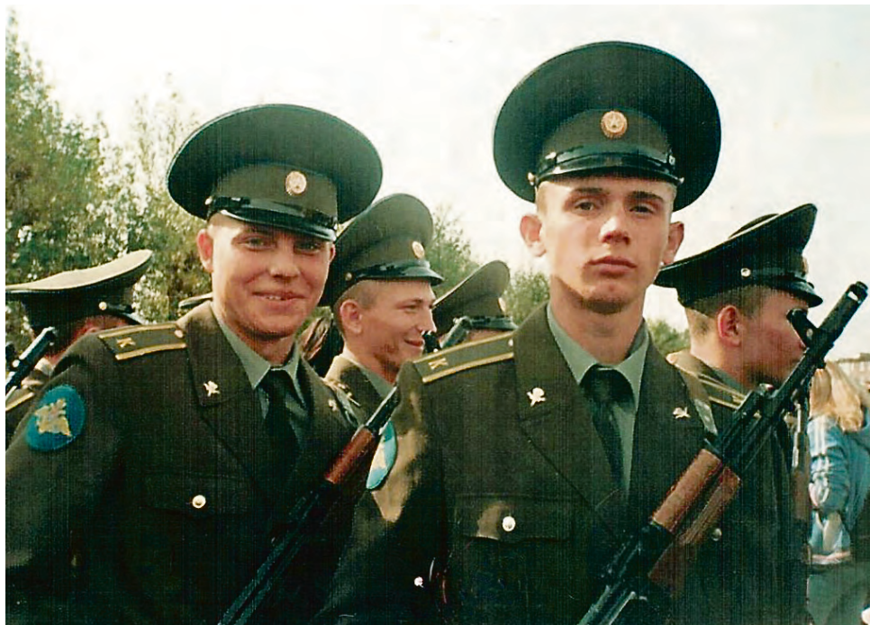
С товарищем на присяге.

Номер войсковой части вы можете узнать в военном комиссариате по месту жительства.