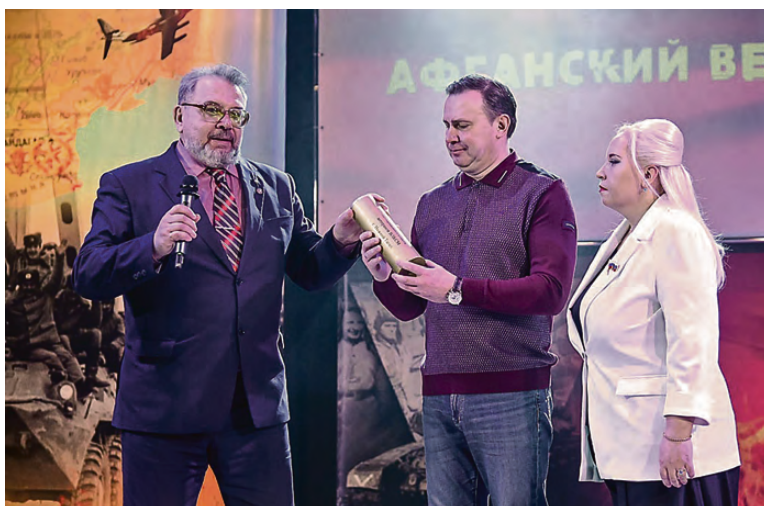
Главе города вручают капсулу с землей Донбасса.

Победителей и призеров фестиваля встретить не так легко, все репетируют перед выходом на сцену. Было подано более 120 конкурсных заявок, отборочные туры прошли более 200 вокалистов из Нижнего