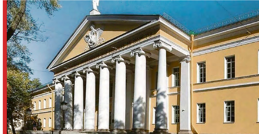
На левом фото городская Демидовская больница. После ремонта здание будет выглядеть не хуже, чем Мариинская больница в Санкт-Петербурге (правое фото).