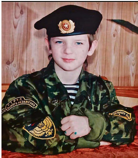
Ребенком - в спецназе.

- Сказали спасибо, что приехали, - говорит морпех. - Мы понимали, что нужно делать, знаем, как работать. Защищали леса, поселки. Были в Стаханове и в лесах под Волновахой. Ничего страшного не было.