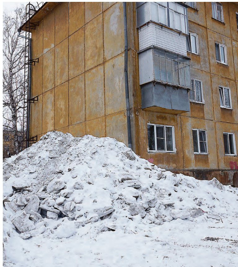
Грибоедова, 5. Гора снега до второго этажа - результат последней уборки.