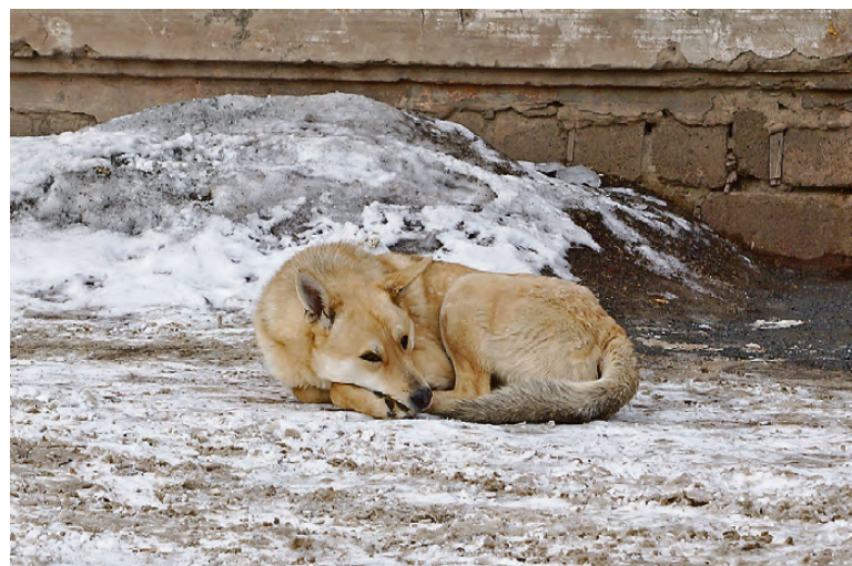
Черноморская, 37. Одинокий пес устало смотрит на нечищенный двор.