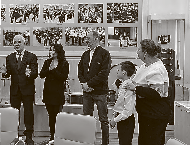
Открытие новой выставки в музее истории.

Тагиле открывает наша колонна. И эта традиция – весомый вклад в формирование плектива, в формирование уважительного отношения к нему каждой личности.