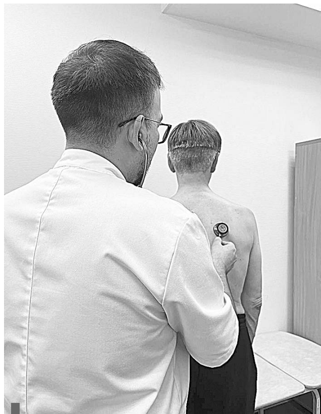
Для пневмонии характерны одышка и невозможность дышать полной грудью

В 2022 году в нашей стране было зарегистрировано около 600 тысяч случаев внебольничной пневмонии, которая, по данным Роспотребнадзора, унесла жизни 43 тысяч россиян.