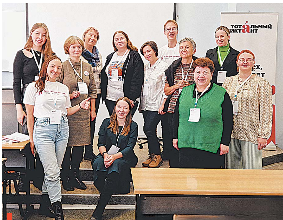
У организаторов Тотального диктанта настрой всегда только позитивный

Сухоложцам и тут было что сказать и показать: в багаже у газеты «Знамя Победы» начиная с 2018 года 38 тематических страниц «Говорим по-русски», посредством которых расширяются и углубляются знания читателей о русском языке. Участники УШК с ин-