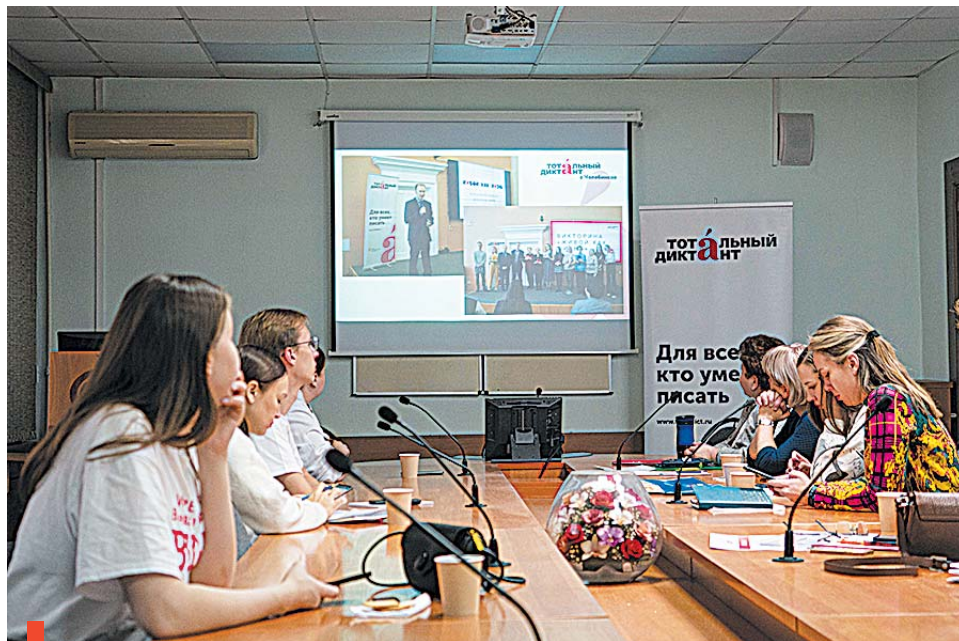
На заседании УШК в Челябинском госуниверситете

«Грамотеи» – так теперь называется наш редакционный клуб любителей русского языка. Имя выбрали сообщца путем голосования.