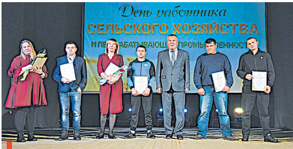
Церемония награждения благодарственными письмами и почетными грамотами Думы городского округа Сухой Лог

В преддверии профессионального праздника проходил конкурс на профмастерство среди работников всех сельхозпредприятий Богдановичского и Сухоложского районов. Называем имена отличившихся сухоложцев: