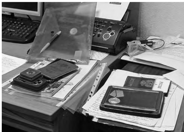
Подготовила Елена АБРАМОВА.

При себе иметь: копию паспорта, копию удостоверения о наградах, справку о помиловании, если такой нет, нужно сделать запрос через МФЦ.