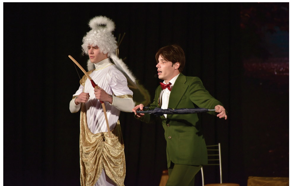
Театральная труппа «Браво!» со спектаклем «Забавное приключение»