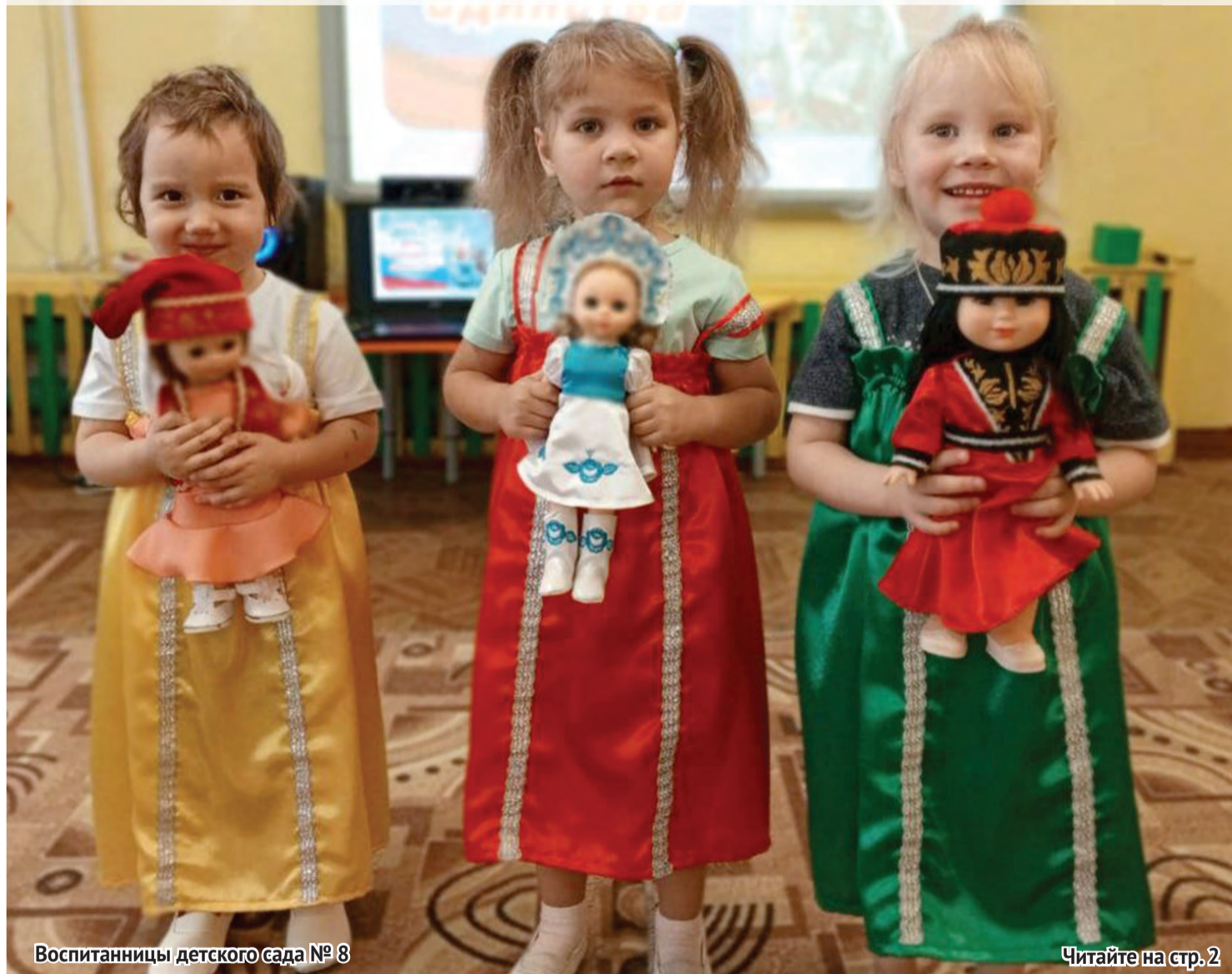
Воспитанницы детского сада № 8