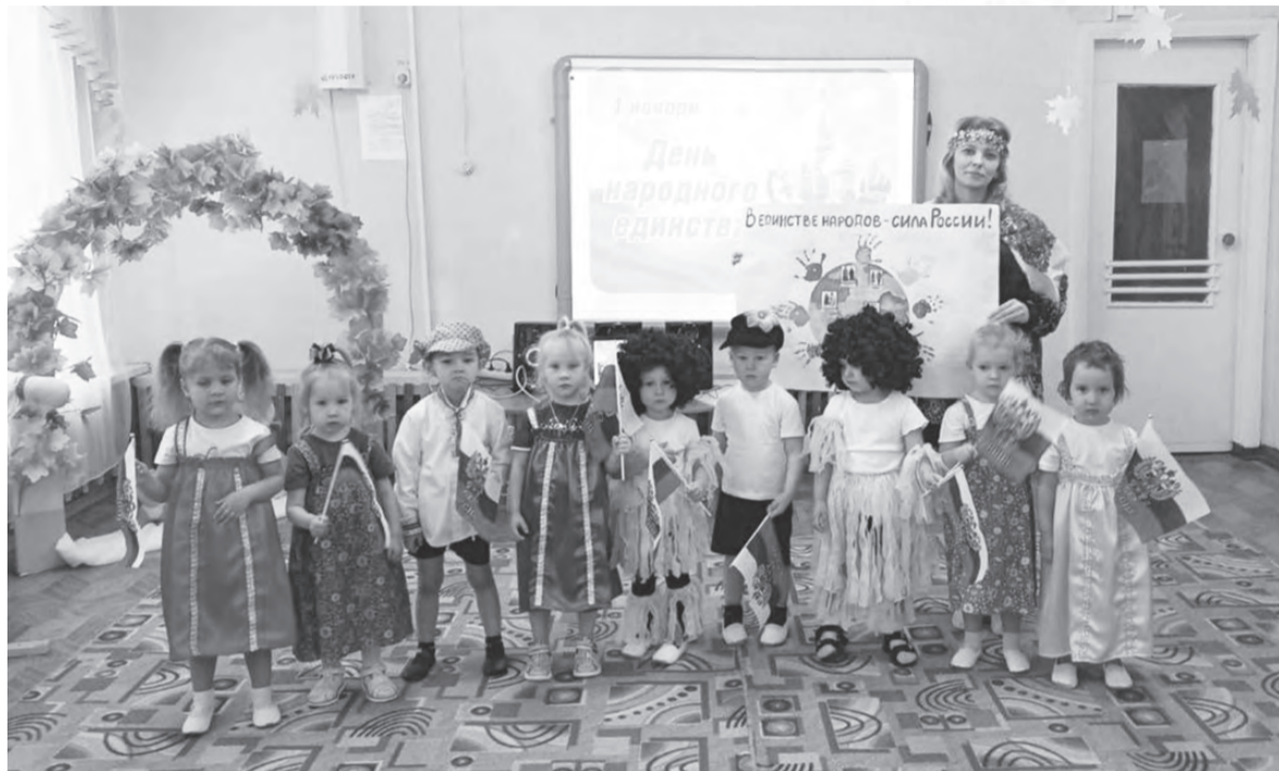
Воспитанники второй младшей группы