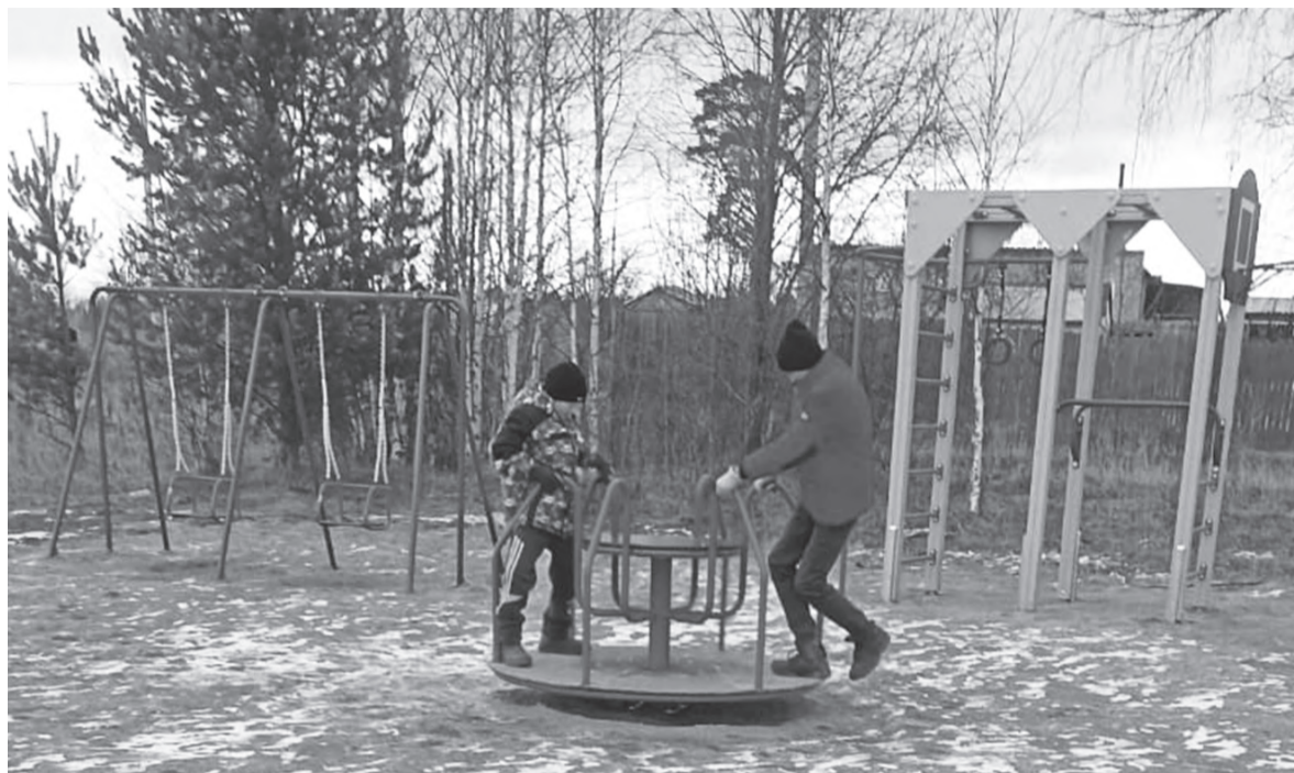
Первые посетители детской площадки