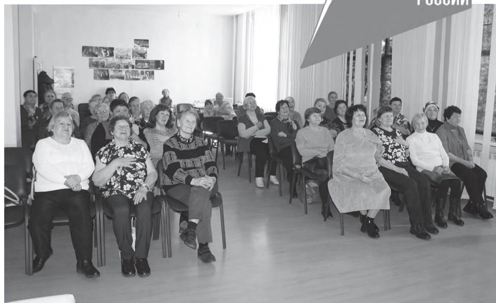
Ветераны комсомольской организации

Люди золотого возраста с удовольствием спели такие песни, как «Гимн демокра-