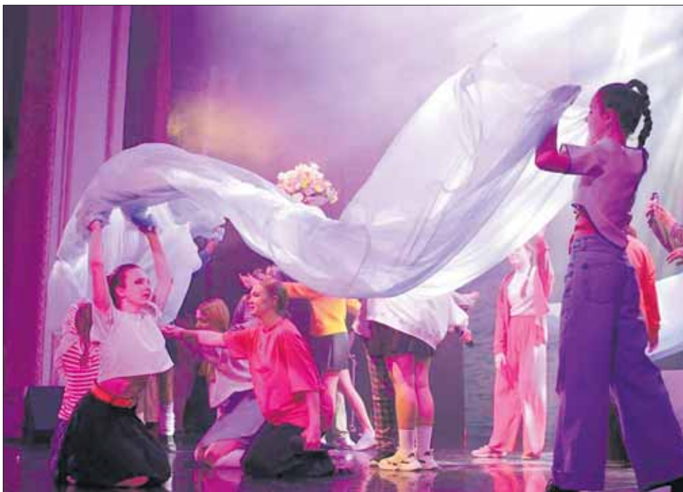
Артисты ДК дарили публике танцы...