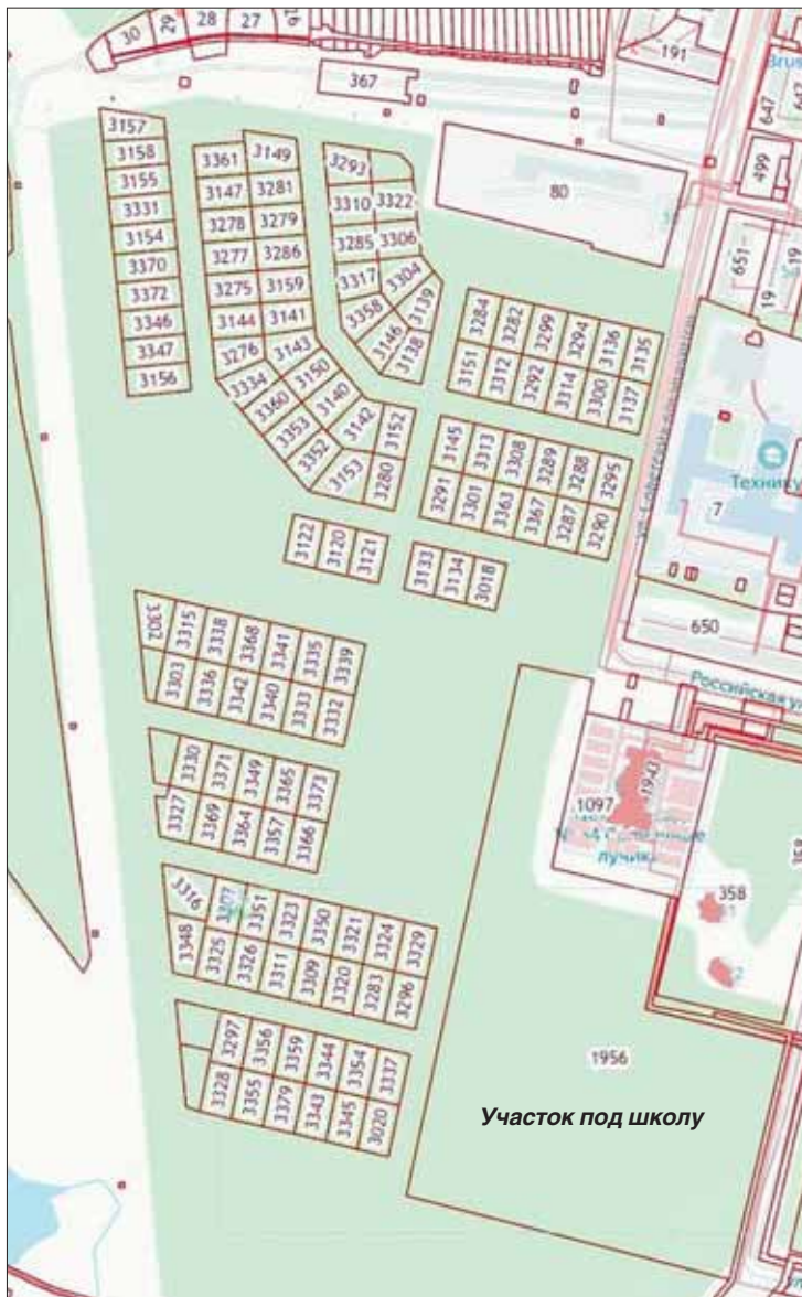
Скриншот публичной кадастровой карты

(435 квартир, около тысячи жителей). В квартале должны были появиться общеобразовательная школа с учреждением допобразования, а еще два магазина и два объекта бытового обслуживания. И, конечно, озеленение, детские и спортивные площадки.