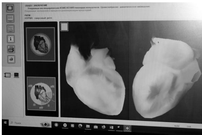
Сердце Ксении МАЛЫГИНОЙ.