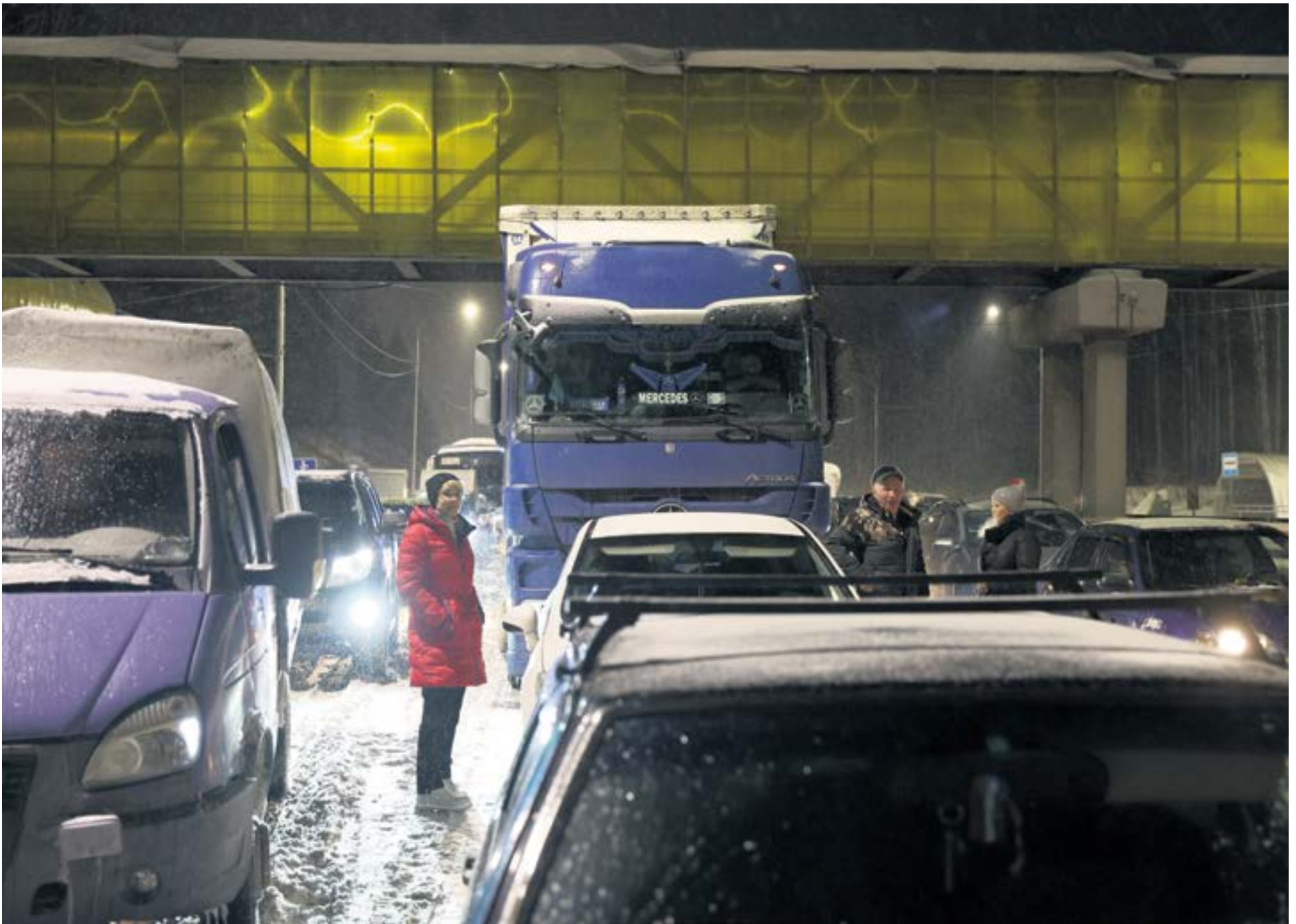
Множество людей оказались в снежном плену на трассе Пермь-Екатеринбург.