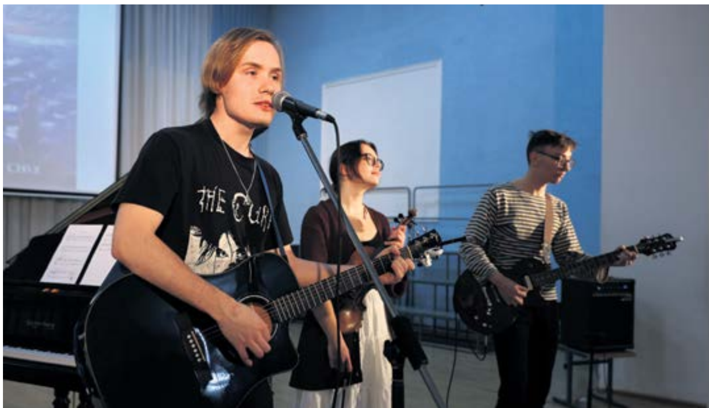
Все исполняемые группой песни ребята пишут сами.