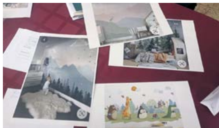
Эскизы того, как девушки хотят преобразить детскую группу.

Сейчас накидал себе план, чем займусь в первую очередь, потому что вопросы, правда, классные. Такие проблемы решать интересно.