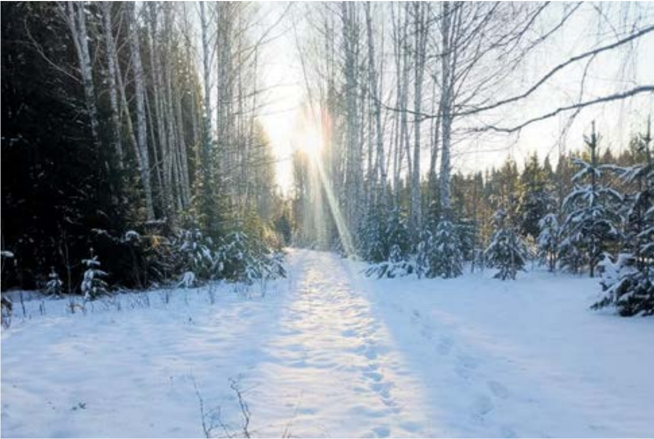
Трасса практически готова и ждет своих победителей.

Любителей уральского бездорожья ожидает новая гонка