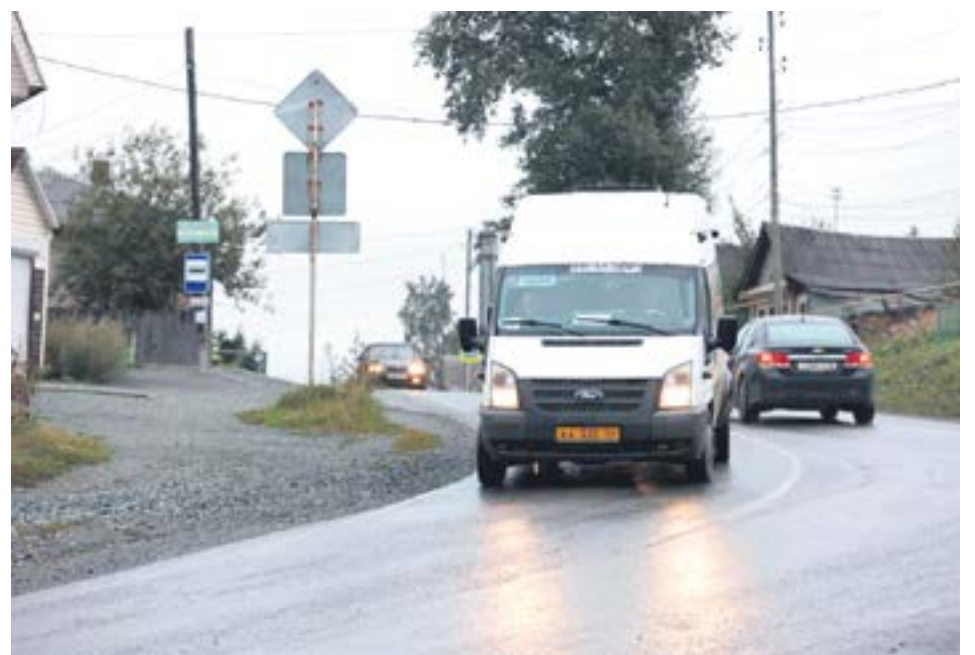
Потенциальный перевозчик будет разыгрывать обслуживание маршрутов через конкурс.

Пока неизвестны варианты потенциальных перевозчиков, но администрация рассчитывает на более презентабельный автопарк, нежели муниципальный. Также известно, что