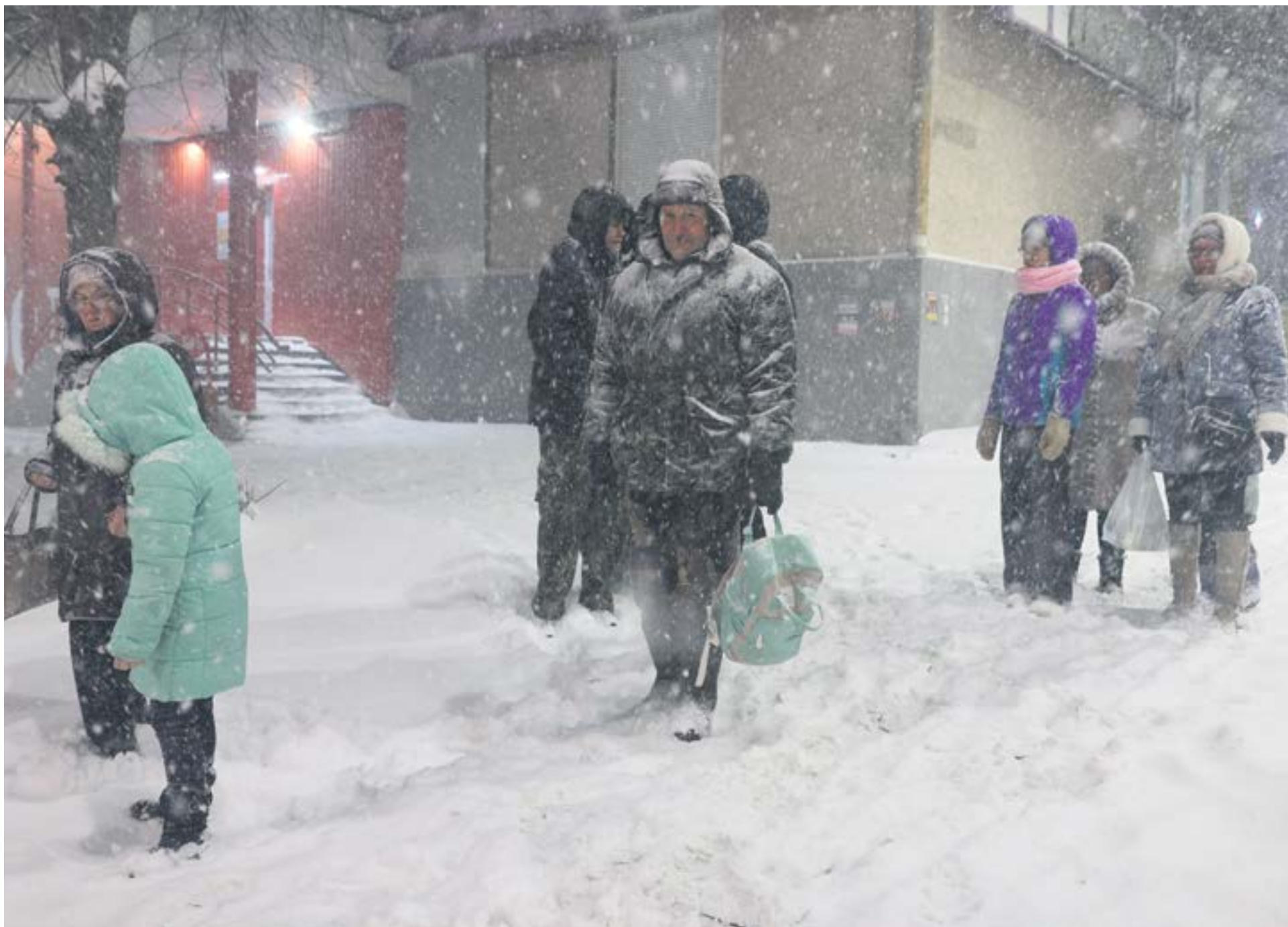
За время аномального снегопада высота снежного покрова в Ревде составила 21 см, что является рекордом для области.

Филиппов, по распоряжению которого проблемный участок взяла под контроль «Армада». Старую дорогу полностью посыпали отсевом, уделив внимание не только проблемным участкам, но и всему остальному пути, в целях профилактики подобных ситуаций.