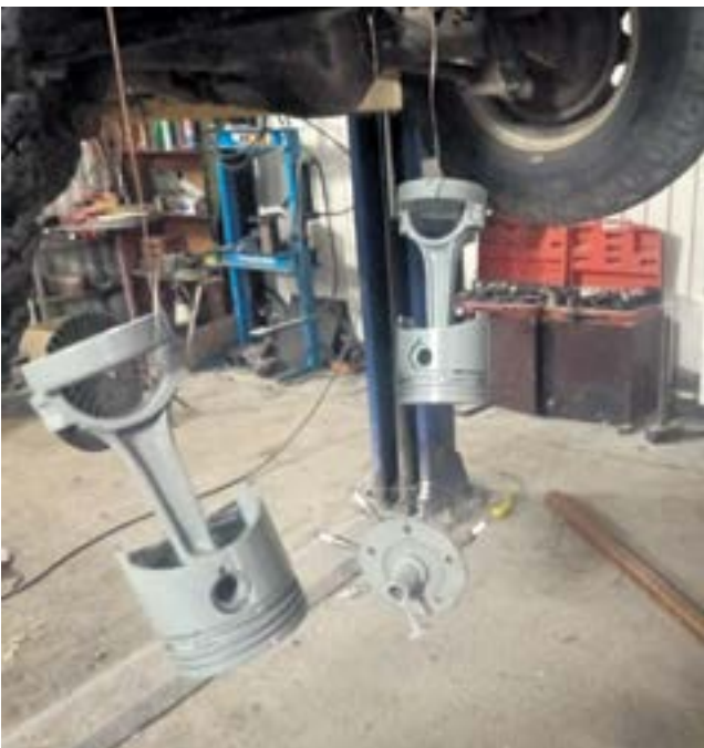
Алексей Лесников уже готовит кубки для победителей соревнований. Кроме них они получают денежные призы и сертификаты.

Для каждой категории участников подготовлен свой