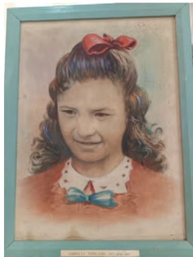
Картина с выставки «Мир глазами художника»

Художественным событием стала выставка «Мир глазами художника». Организатором выставки стал Музей истории Бисертского городского округа, который в фойе Дома культуры представил выставку работ бисертских художников, творивших в Бисертском городском округе в двадцатом и двадцать первом веках.