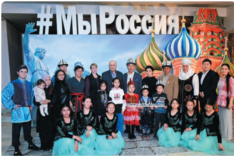
Фестиваль #МыРоссия в Екатеринбурге

Посетители подолгу задерживаются у каждой локации экспозиции Среднего Урала, делают селфи на фоне видеопанели с видами Свердловской области, тестируют зону с интерактивной доменной печью.