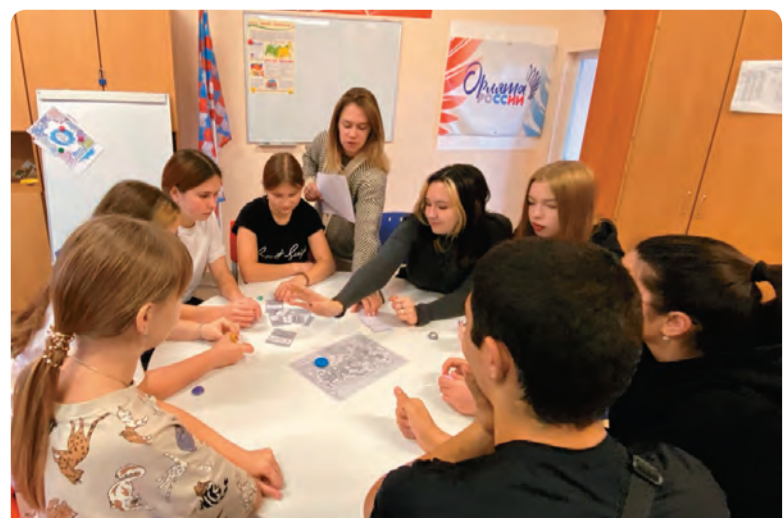
Игра «Что я знаю о России», Бисертская средняя школа №2

ВЫСТАВКА-ФОРУМ «РОССИЯ» будет проходить на ВДНХ в Москве с 4 ноября 2023 года по 12 апреля 2024 года.