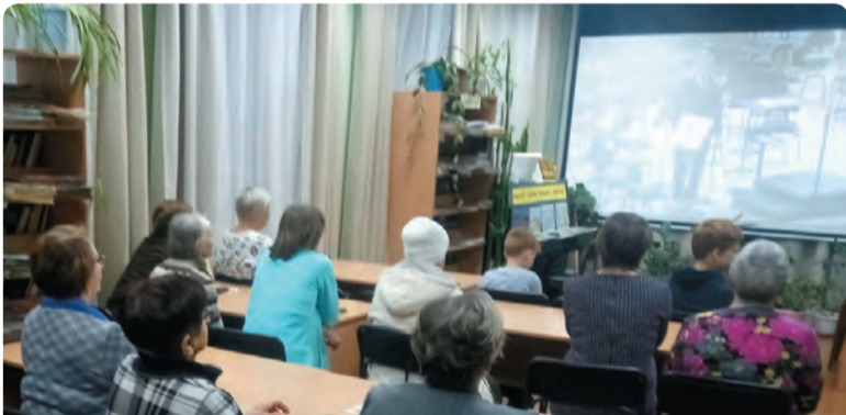
Вечер органной музыки в Бисертской библиотеке

Вот, например, во вторник, 31 октября, Бисертская поселковая библиотека провела у себя большой вечер органной музыки – в Виртуальном концертном зале библиотеки выступал Уральский