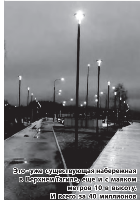
Это -уже существующая набережная в Верхнем Тагиле, еще и с маяком метров 10 в высоту. И всего за 40 миллионов