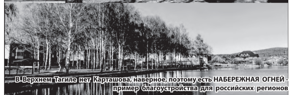
В Верхнем Тагиле нет Карташова, наверное, поэтому есть НАБЕРЕЖНАЯ ОГНЕЙ - пример благоустройства для российских регионов