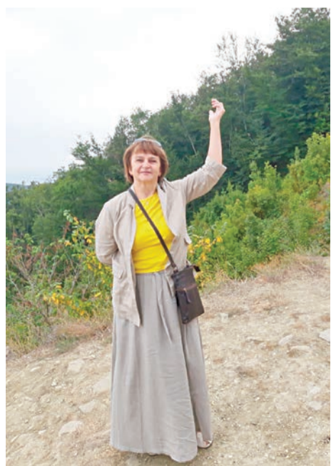
Город Губа, расположенный на горе, произвел большое впечатление

Проспекты в городе очень широкие. Старинные дома, в том числе сталинской постройки, отреставрированы и содержатся в хорошем состоянии. Частные дома и стихийные самострои сносятся и на их месте возводятся современные жилые комплексы. Но не так близко друг от друга, как в Екатеринбурге. После сдачи домов их продолжают обслуживать компании застройщиков.