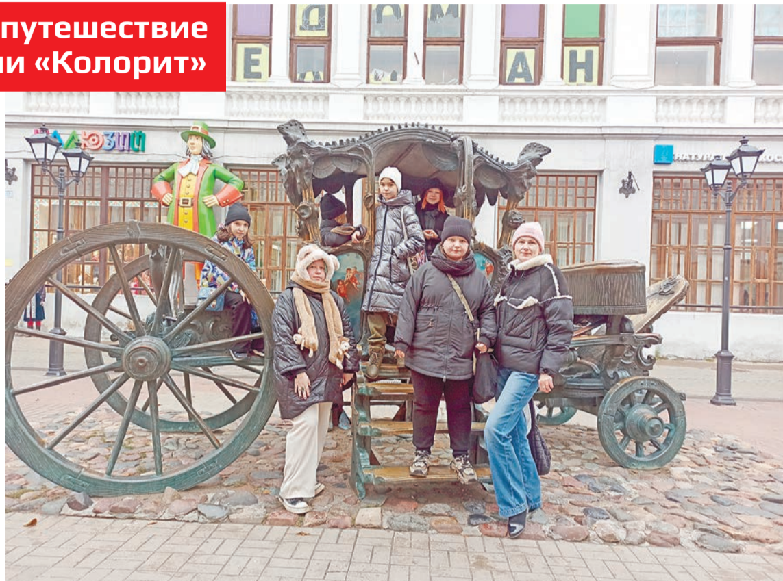
Украшение Казани — бронзовая копия кареты Екатерины II

Мы с ребятами получили огромный творческий, эмоциональный заряд и массу очень интересной и