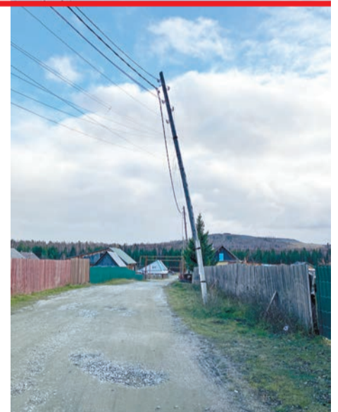
Этот столб в переулке между улицами Нижней и Набережной уже упал

Вот такую историю о «пьяных» столбах рассказал нам житель Валериановска. Посёлка, который участвует в конкурсе «Здоровое село: территория трезвости».