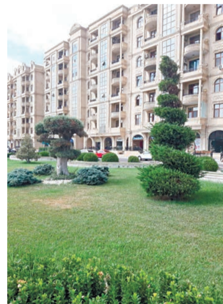
Старые дома содержатся в хорошем состоянии

специалисты заканчивают вузы и сидят дома. Частные клиники есть, но там работают врачи с высшей категорией, профессора, кандидаты наук. Или те, кто прошёл стажировку за рубежом.