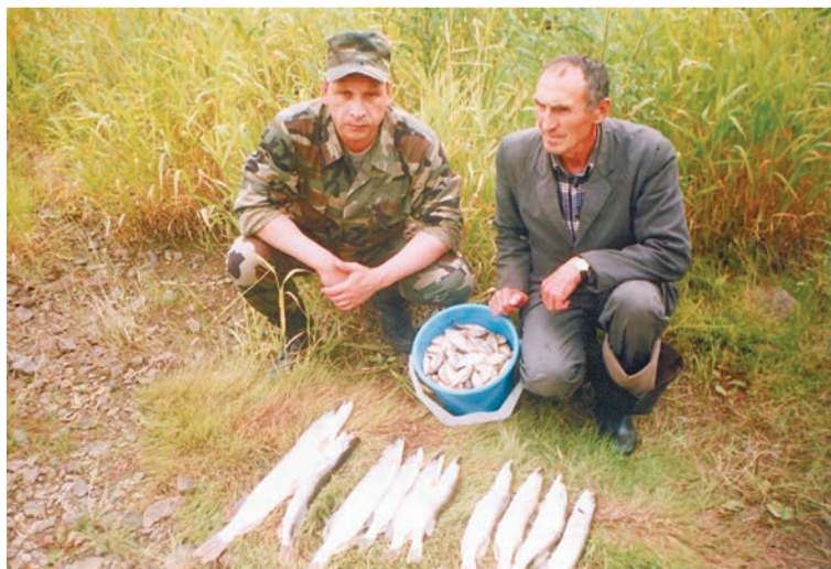
Одно из любимых увлечений — рыбалка