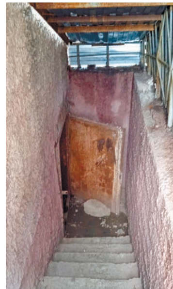
Внутри подвала стоит вода и пахнет канализацией

Старшая по дому и куратор отвечают, что не хватает