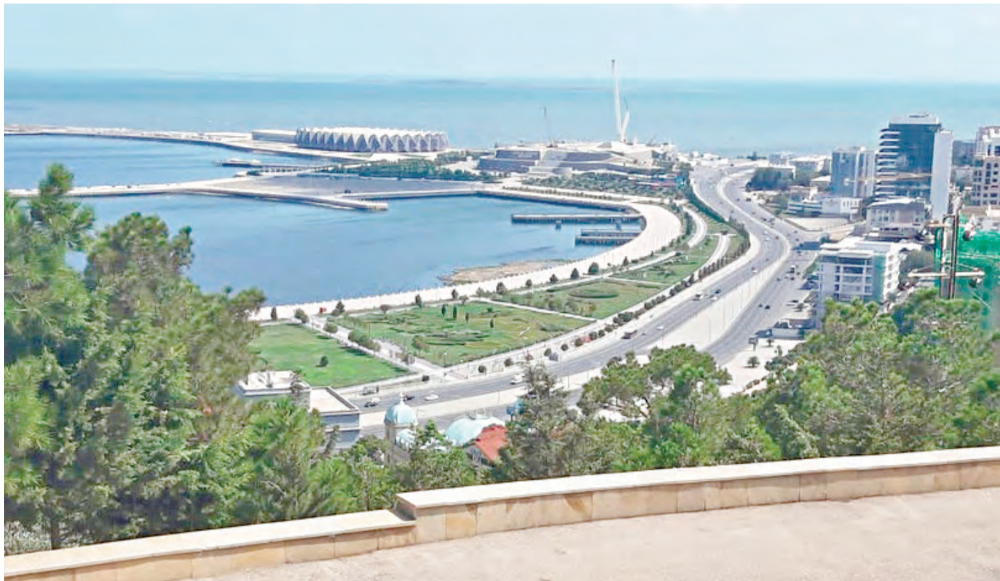
Каспийское море и Апшеронский полуостров с центрального парка видны как на ладони

Центральное отопление в городе почти отсутствует за ненадобностью, применяется чаще всего автономное отопление.