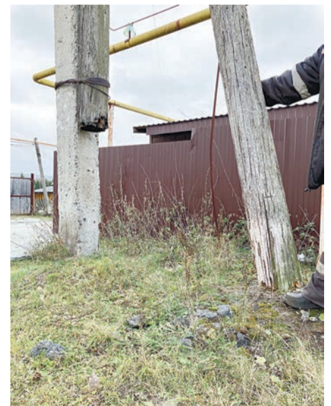
Опора у этого накренившегося столба лишь для видимости