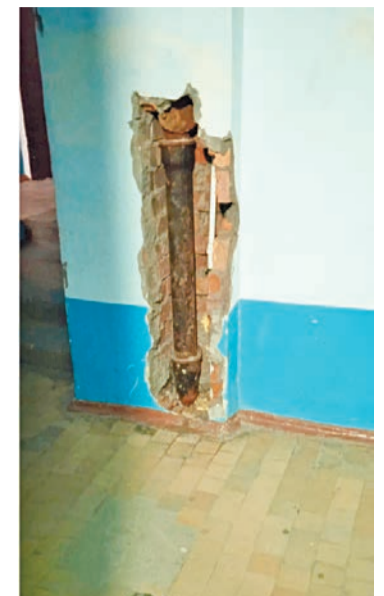
Открытые трубы в подъездах

работников. Зато плата растёт постоянно.