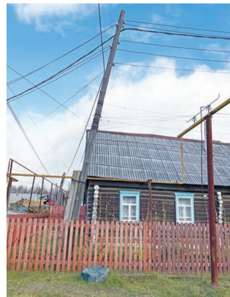
Столб на улице Нижней вот-вот упадет на дом и на газовую трубу