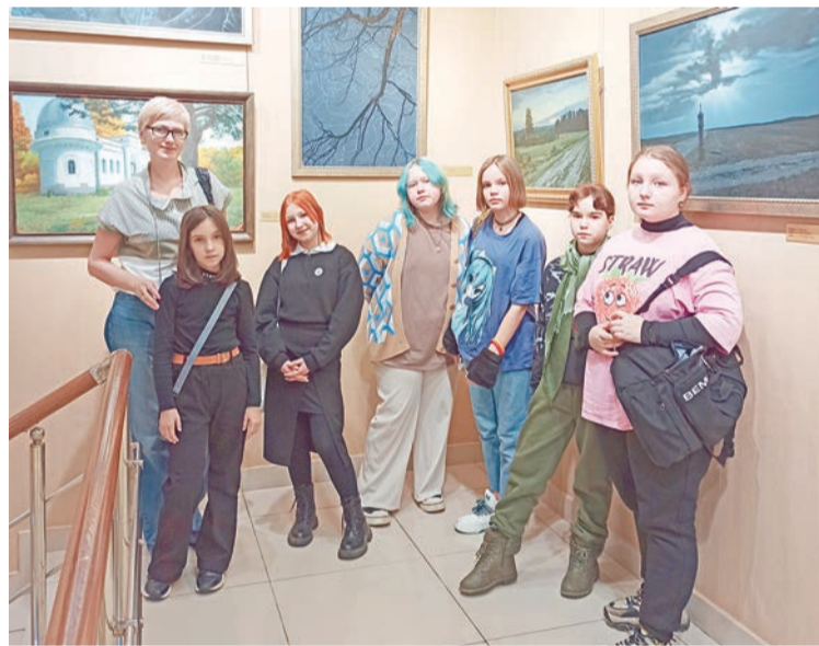
От посещения дома-музея художника Константина Васильева получили огромный творческий заряд

Прогулялись по улице Баумана — это местный Арбат. На всем ее протяжении с обеих сторон расположились маленькие и симпатичные фонтанчики, фигурки мультяшных геро-