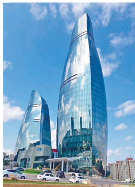
Новостройки из стекла и бетона напомнили Эмираты

Из разговоров с местными я узнала, что устроиться на работу учителями, врачами, бюджетниками, фармацевтами очень трудно, все места заняты. Зарплаты небольшие, но вакансий нет. Поэтому молодые