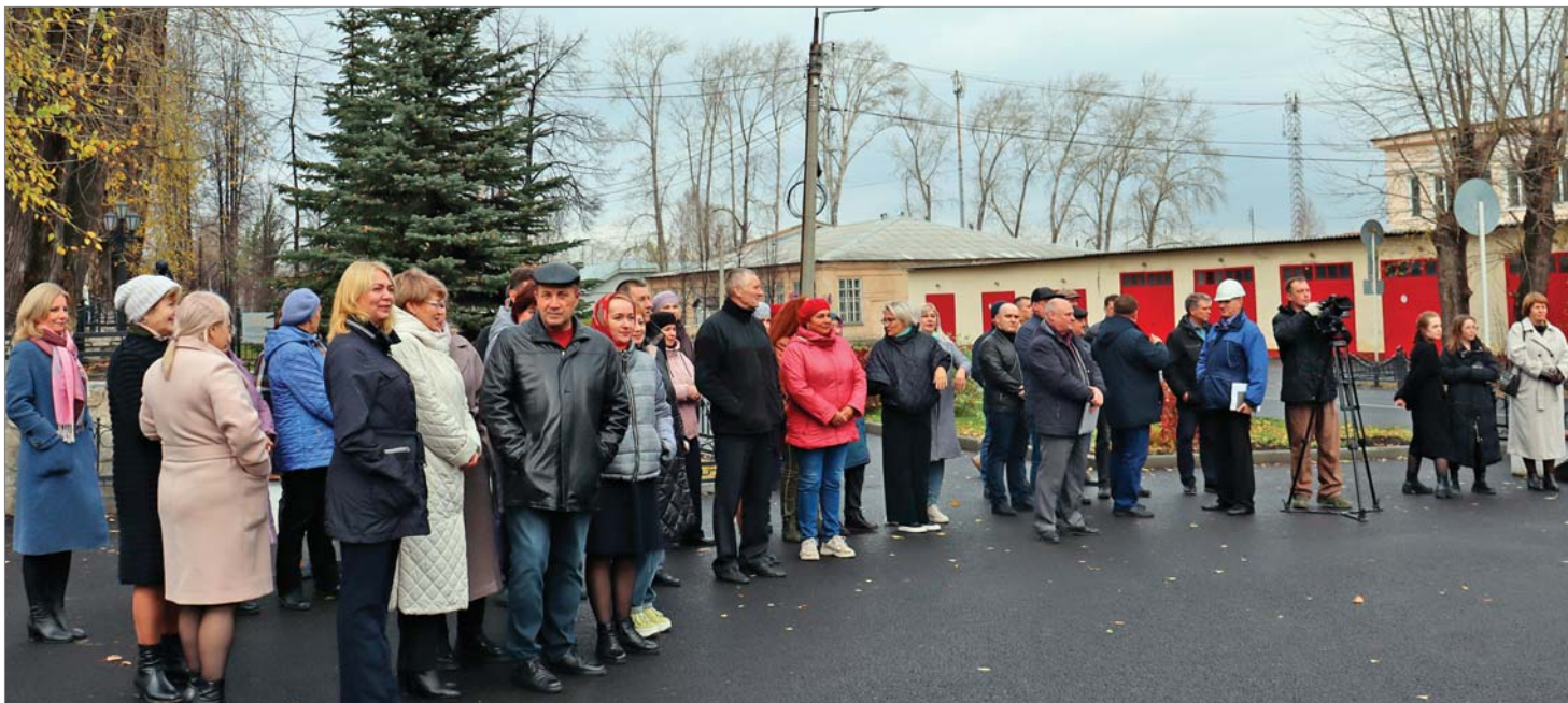
Заводчане собираются на торжественный митинг у заводской проходной.

За грамотную организацию работ при проведении ремонта дорог на улицах Динаса в июне-сентябре 2023 года, за профессиональное выполнение контракта, обеспечение высокого качества и соблюдение сроков Благодарственными письмами от «ДИНУРА» награждены управляющий ООО «Битумен»