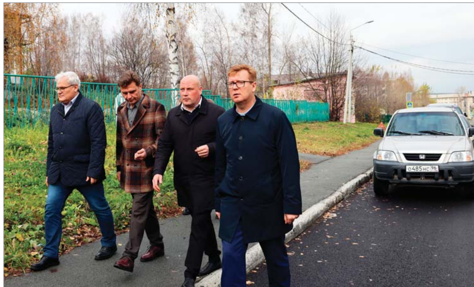
Первая остановка на улице Пушкина возле двух школ – пятнадцатой общеобразовательной и художественной.

- Все годы истории нашего завода руководство заботилось о благоустройстве микрорайона, где живут