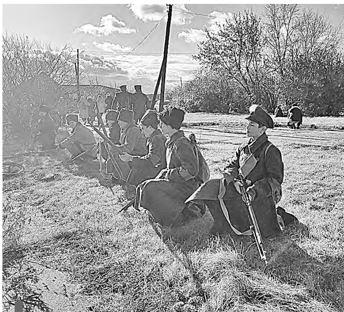
Реконструированный бой: на позиции красноармейцев

Участники состязаний собирали-разбирали автомат, стреляли из пневматической винтовки или пистолета, метали гранаты, пробовали силы в «Покровской пикетной стрельбе», православной викторине, мастер-классах. На сборы, длившиеся с 13 по 15 октября, приехало 170 детей.