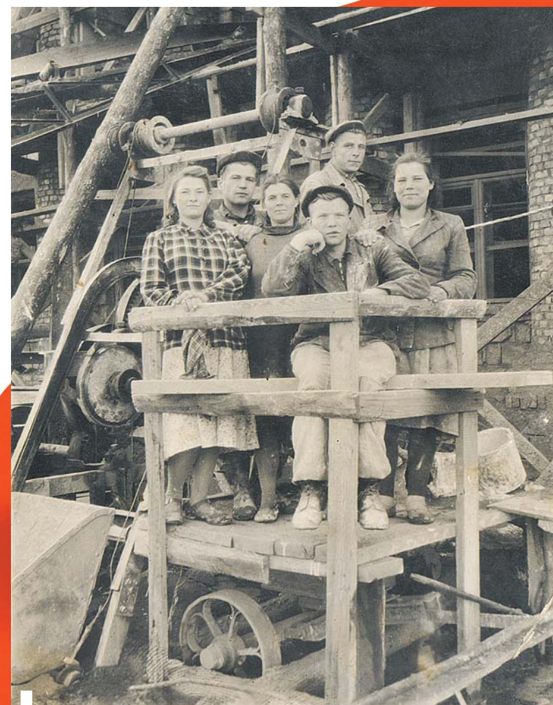
На комсомольском субботнике, 1930-е