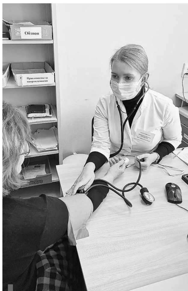
Давление выше нормы создает риск развития сердечно-сосудистых заболеваний

Соблюдение этих правил поможет предотвратить возникновение многих болезней и сохранит ваше здоровье на долгие годы.