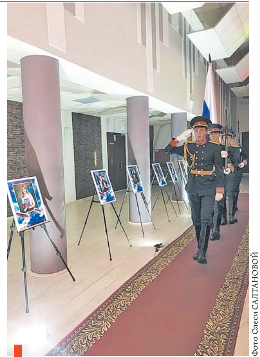
Внос государственного флага