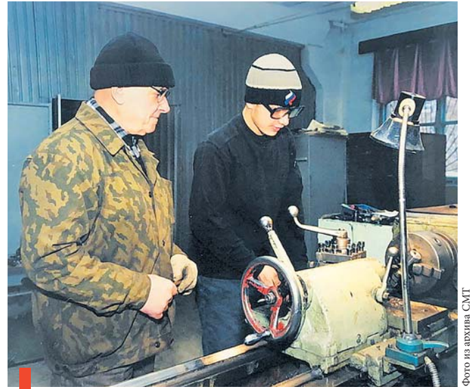
Практические занятия в мастерской училища, 2007 г.

Планировалось, что учащиеся СПТУ будут выпускать готовую продукцию: кондукторы по резке и отпиливанию металла для мастерских школ и профтехучилищ Свердловской области. В течение учебного года будущим токарям и слесарям предстояло изготовить 400 таких приспособлений.