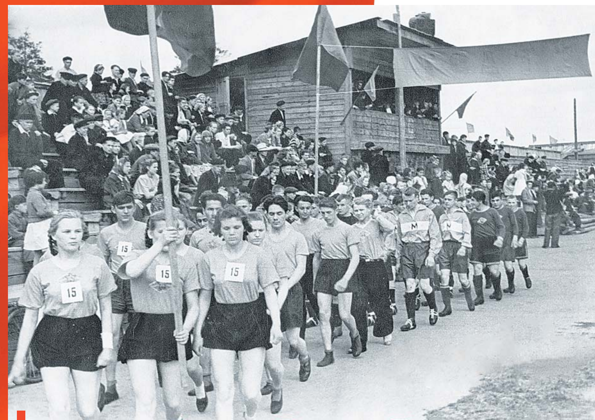
Колонна спортсменов шамотного завода на Дне физкультурника, 1955 г.

В 60-х комсомольцы завода включились в борьбу за увеличение срока службы огнеупорных изделий в металлургической промышленности.