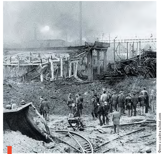
Груды металла и железобетона на месте взрыва

На помощь пострадавшим мобилизовался не только весь Свердловск, но и другие города. Не стал исключением и Сухой Лог. Комбинат асбестоцементных изделий уже 4 октября начал отгрузку шифера. Вагоны с ним ежедневно уходили в адрес пострадавших районов областного центра. Всего сверх лимитов на ремонт зданий сухоложцы отгрузили 5 миллионов условных плиток шифера.