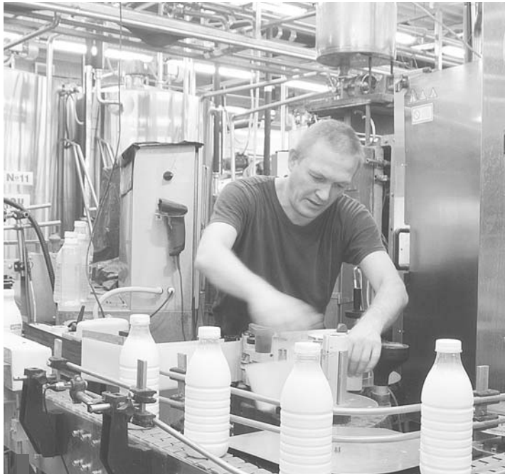
В молочном цехе ООО «Новопышминское»

О первых результатах можно будет судить через три месяца после старта проекта (7 сентября). Участие в программе позволит предприятию выйти на качественно новый уровень управления, даст стабильный рост производительности труда и конкурентоспособности.