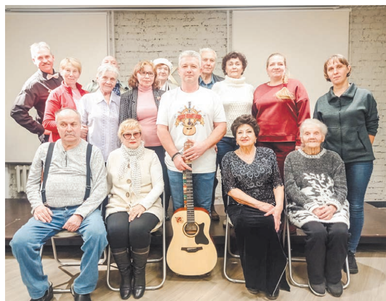
Участники встречи – барды и поэты