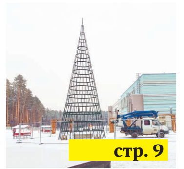
Собираем посылки за ленточку