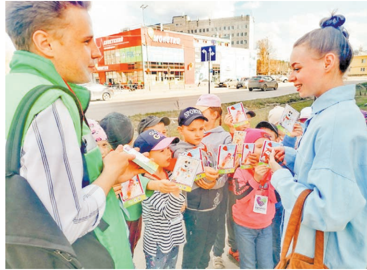
В апреле волонтеры «ОК» провели благотворительную акцию "Дай на лапу" вместе с воспитанниками детского сада №22: подняли прохожим настроение и рассказали о проблеме бездомных животных

Вообще, хочется объять необъятное, попробовать в этой жизни все. Знаете, что я понял в этой жизни? Время есть всегда. Не всегда есть искреннее желание делать что-то прямо сейчас.