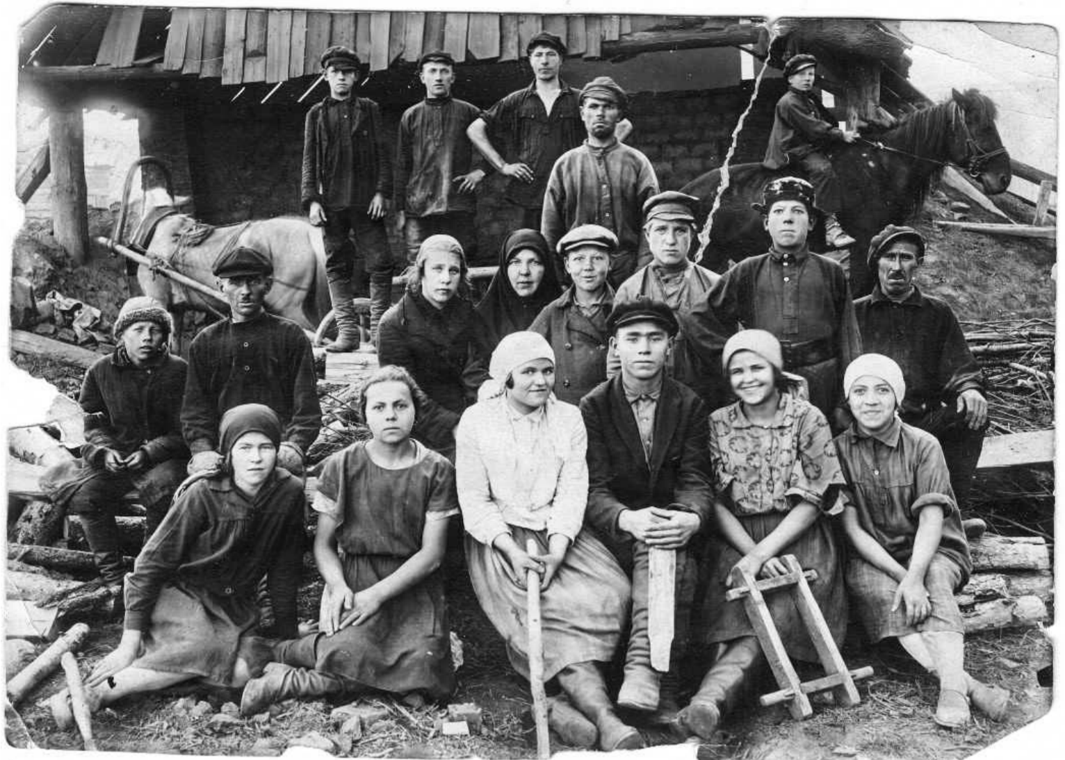
1926 год. Комсомольцы на восстановлении кирпичного завода

Первое время после освобождения Урала от Колчака экономическое положение горняков было крайне тяжелым, золотые промыслы бездействовали. Белогвардейцы перед отступлением затопили шахты, уничтожили техническую документацию, вывезли с собой наиболее ценное оборудование и машины.