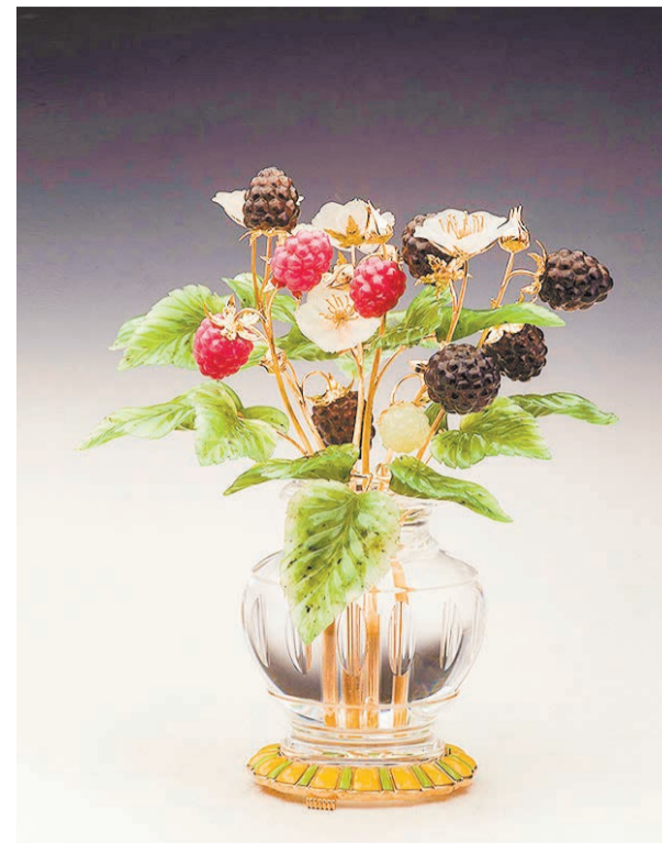
Произведения «Камнерезного дома Алексея Антонова»

можно увидеть особый вид кальцитов, которых в мире насчитывается всего 3 экземпляра – и все они представлены здесь.