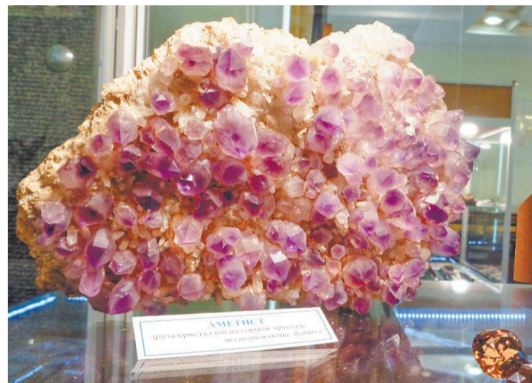
Аметист. Друза кристаллов на горном хрустале

Музей истории камнерезного и ювелирного искусства (ул. Ленина, 37) является единственным в России государственным музеем подобного профиля. Основная экспозиция Музея знакомит посетителей с историей художественной обработки камня XIX – начала XX веков, малахитовыми изделиями, работами завода «Русские самоцветы» в XX веке и современным авторским камнерезным и ювелирным искусством. Предметом гордости музейного собрания являются камнерезные и ювелирные изделия всемирно известной фирмы К. Фаберже (их можно увидеть в «Золотой кладовой»). А с 2015 года в музее большой популярностью пользуется «Изумрудная