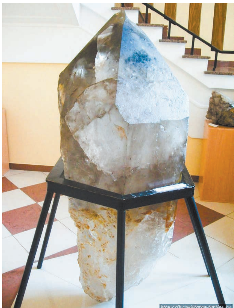
«Малютка» в Уральском геологическом музее

В публикации использованы материалы сайтов: https://ugm.ursmu.ru/ https://mikji.ru/ https://xn--80aebkthcskjbk0k.xn--p1ai/ https://museum-planeta.ru/