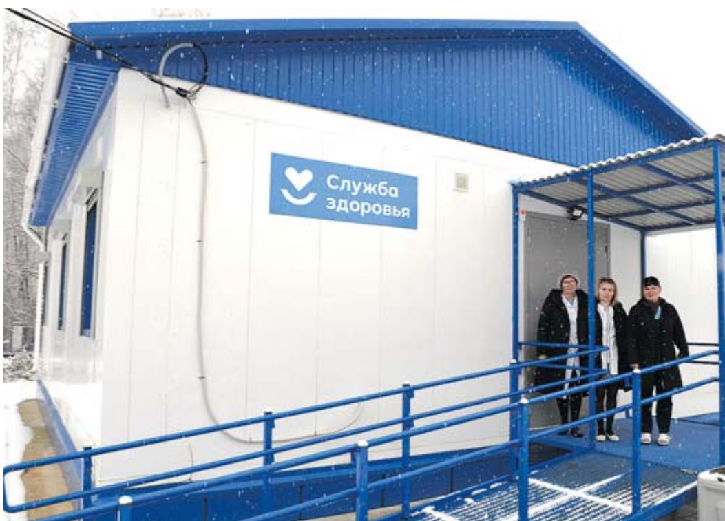
Коллектив Зырянского ФАПа у нового здания

БЕТОН ЩЕБЕНЬ КОЛЬЦА ЖБИ 8-912-204-44-01 www.pcy4.rpf