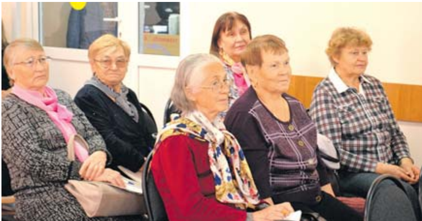
Пенсионеры посёлка Верхняя Синячиха

В посёлке Верхняя Синячиха прошли уроки финансовой грамотности для старшеклассников и пенсионеров. По инициативе «Женского движения ЕДИНОЙ РОССИИ» МО Алапаевское такие уроки прошли в Верхнесинячихинской школе № 3 и Верхнесинячихинской библиотеке.