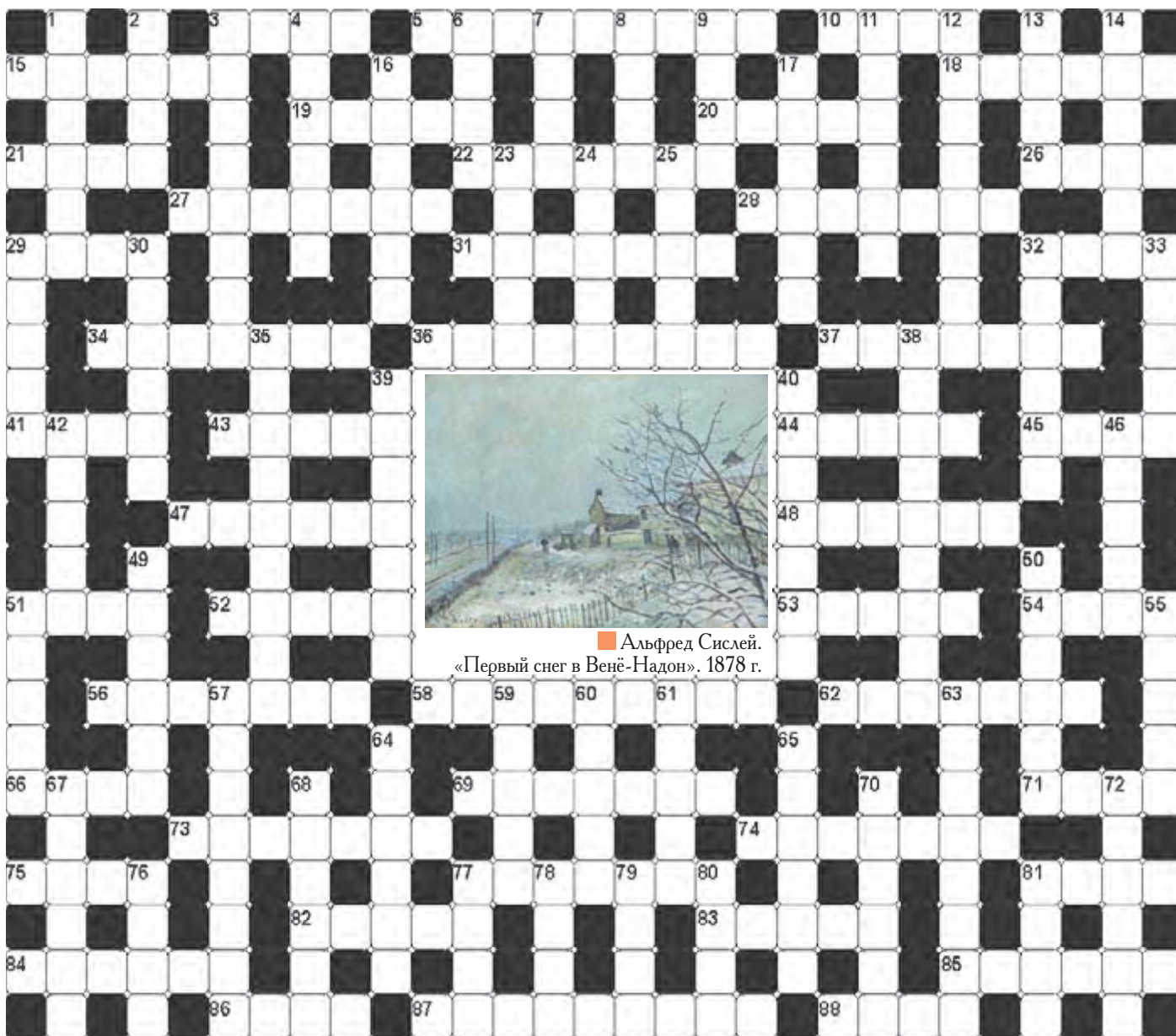
Альфред Сислеи. «Первый снег в Венё-Надон». 1878 г.