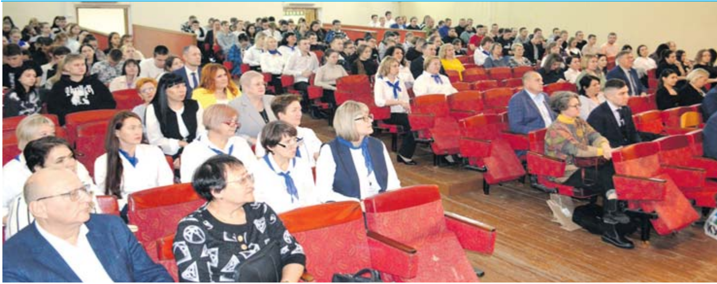
В актовом зале Алапаевского многопрофильного техникума