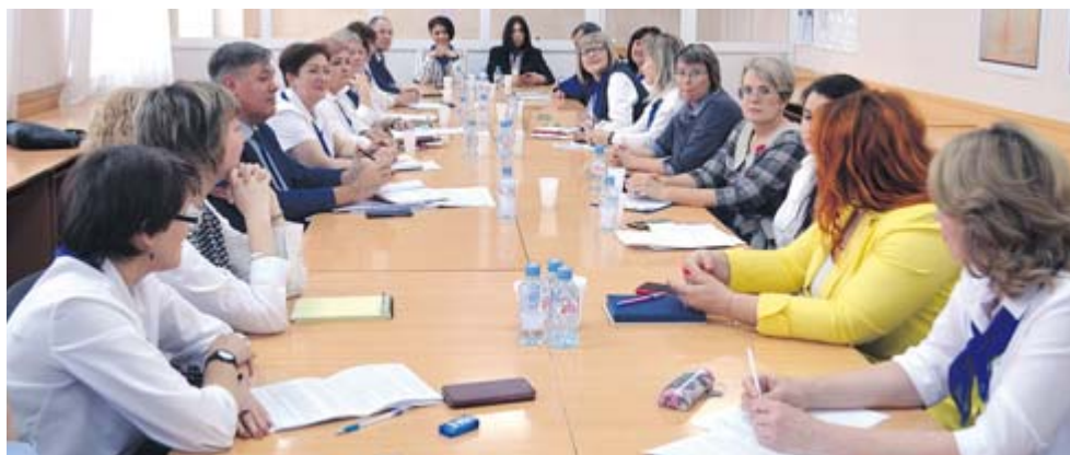
Участники второй секции круглого стола