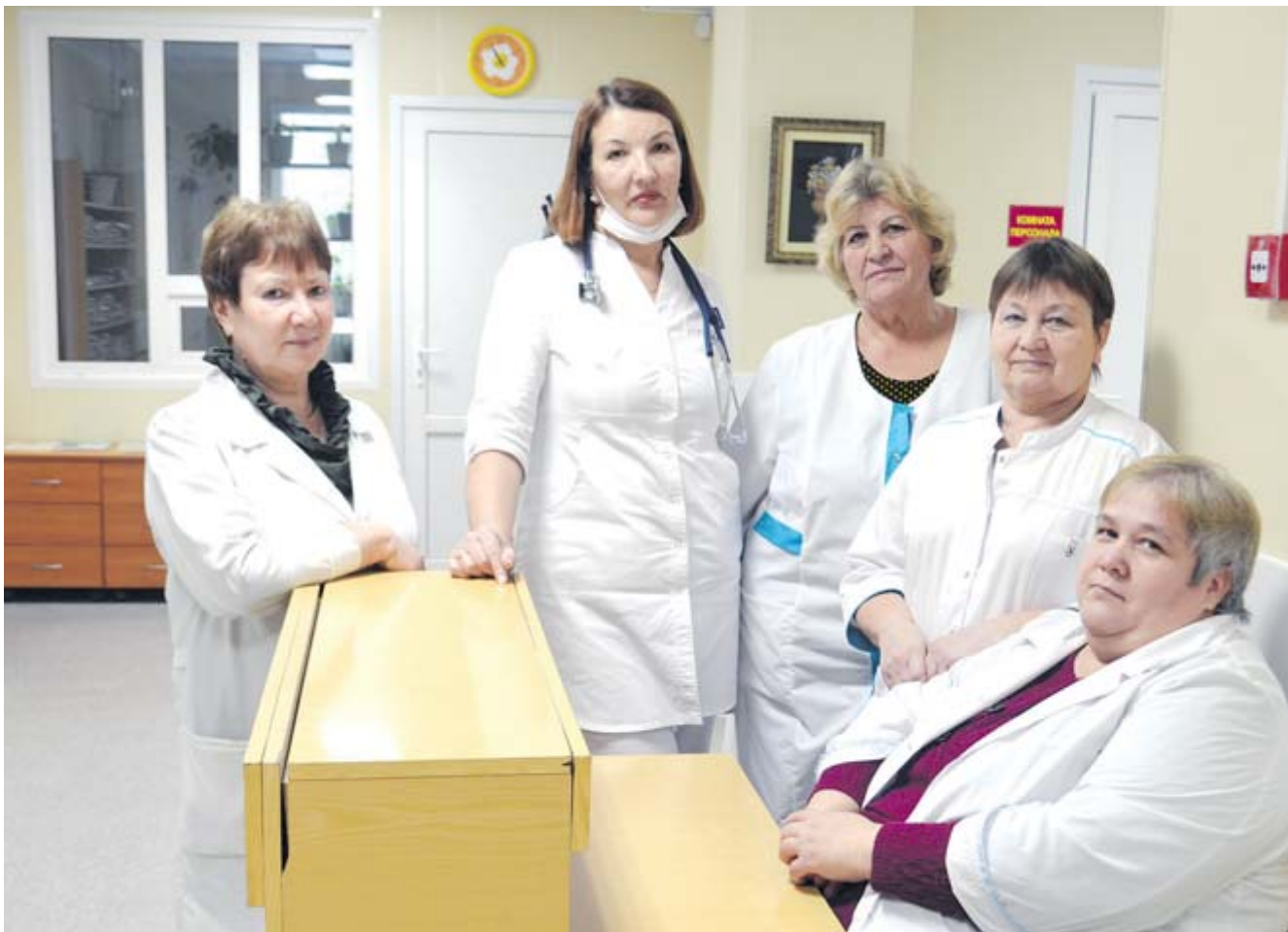
Коллектив Асбестовской ОВП