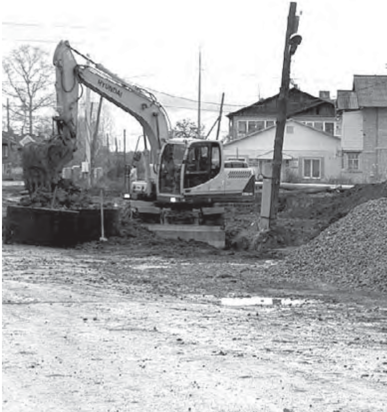
Строительство сетей водоотведения к домам по улицам 40 лет Октября, О. Кошевого, З. Космодемьянской, Крылова на стадии завершения