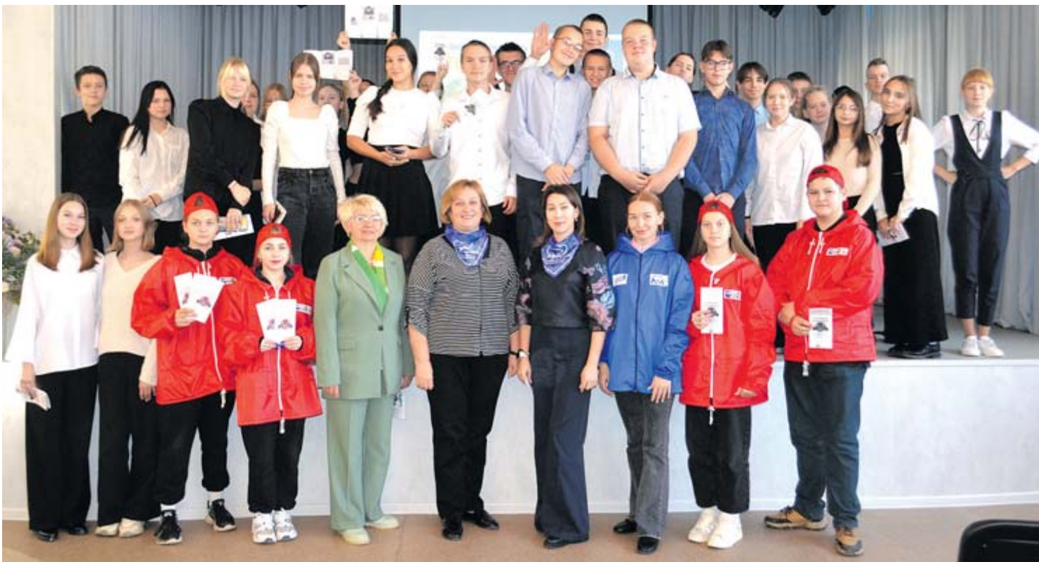
Участники урока финансовой грамотности в Верхнесинячихинской школе № 3