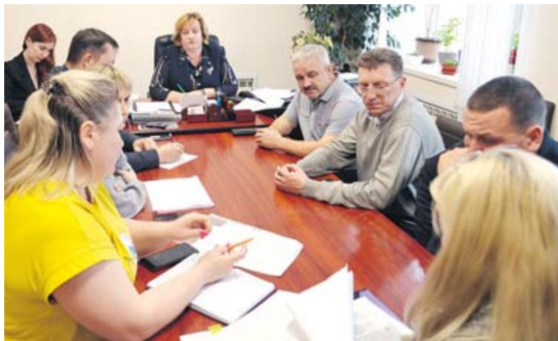
Обсуждение проблем за круглым столом