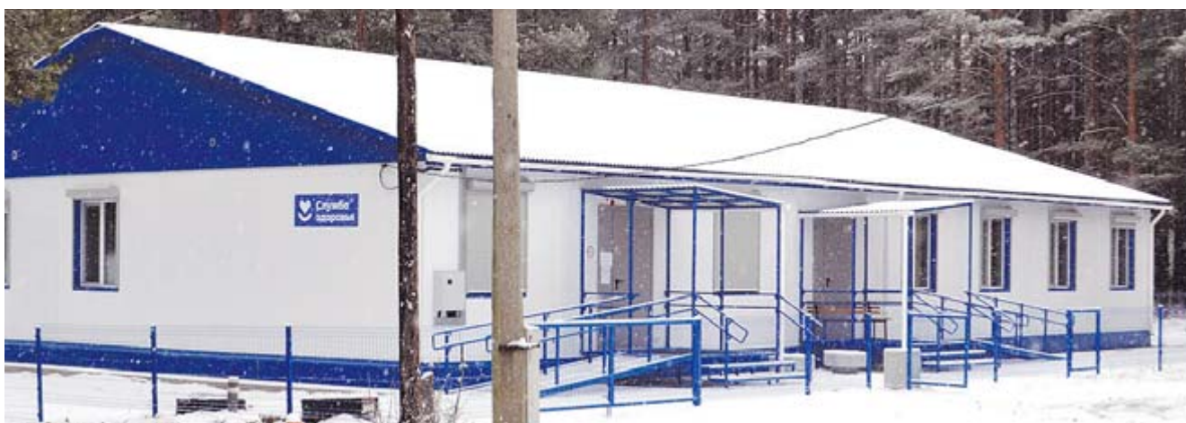
Модульное здание ОВП