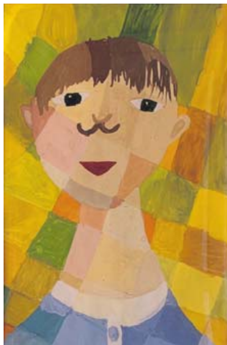
София Малыгина. «Портрет мальчика»