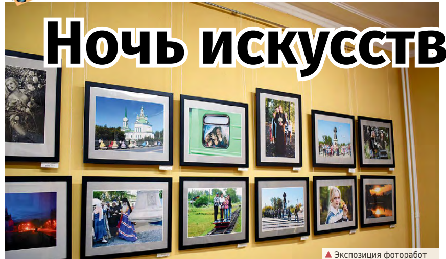
▲ Экспозиция фоторабот