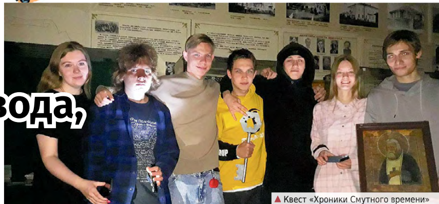
▲ Квест «Хроники Смутного времени»

А началась она с интерактивной детской части – народным праздником осеннего календаря «Кузьминки». В народе говорят: «Как реки морозцем сковывают святые бессребреники Косма и Дамиан, так и счастье куют, радость дарят, здоровье правят!» Юные гости, что пришли на «Кузьминки», узнали много интересного про обычаи и традиции, про древние ремесла, выяснили смысл поговорки «Кузнец – всем ремеслам отец», играли в народные игры. Ох, до чего же теплыми вышли посиделки!