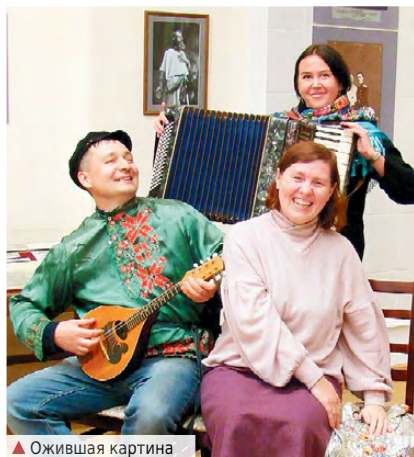
▲ Ожившая картина

В музыкальном салоне гости музея стали участниками теа-