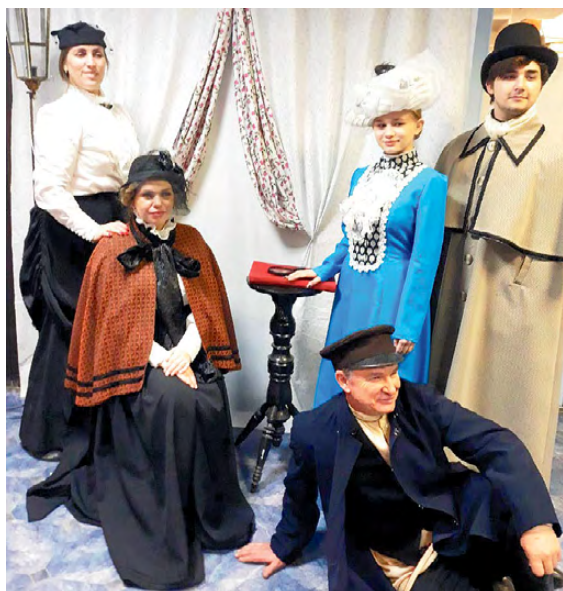
▲ В фотоателье можно было очутиться в прошлом в одно мгновение

Увлекательна, познавательна и содержательна! И это еще не все слова, которыми можно охарактеризовать программу музея истории Алапаевского металлургического завода.