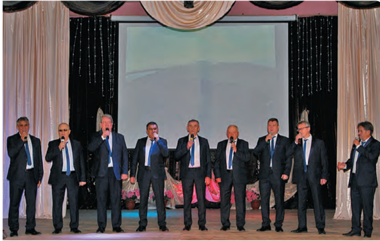
▲ Фото с благотворительного концерта «Песни в помощь фронту»

Около двух недель назад, 2 октября, был объявлен сбор средств на закупку оборудования для мобилизованных из Бисертского городского округа бойцов.