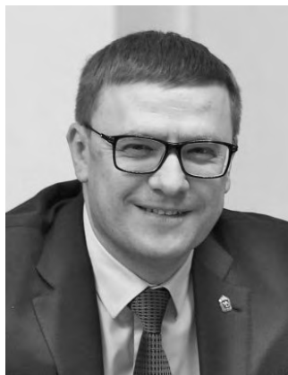
Алексей Текслер: с 2020 года в Челябинской области в два раза увеличили финансирование газификации.

На Южном Урале поэтапно повышают размер областной единовременной выплаты для льготников