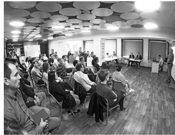
В семинаре приняли участие студенты, преподаватели вузов и представители реального сектора, в том числе из других городов, — они подключились онлайн.

Кафедра, которая готовит управленцев для энергетики и промышленности, уже много лет прорабатывает этот вопрос. При этом все более зреет уверенность, что подготовку менеджеров, во всяком случае для технологически сложных отраслей, необходимо переводить в формат