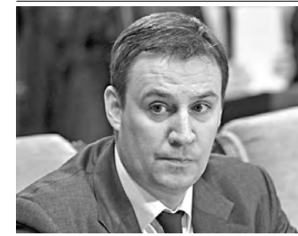
Дмитрий Патрушев, министр сельского хозяйства РФ:

— Урожай 2023 года позволит сполна обеспечить внутренний рынок, а также поставить за рубеж в текущем сезоне до 60 миллионов тонн зерновых. На основании всех прогнозов можно говорить о полноценном обеспечении внутреннего рынка большинством продовольственных товаров. Также вновь рассчитываем и на внушительные объемы нашего экспорта. На данный момент поставили на внешние рынки продукции на 31,3 миллиарда долларов и ожидаем, что по итогам года Россия сохранит статус нетто-экспортера продовольствия.