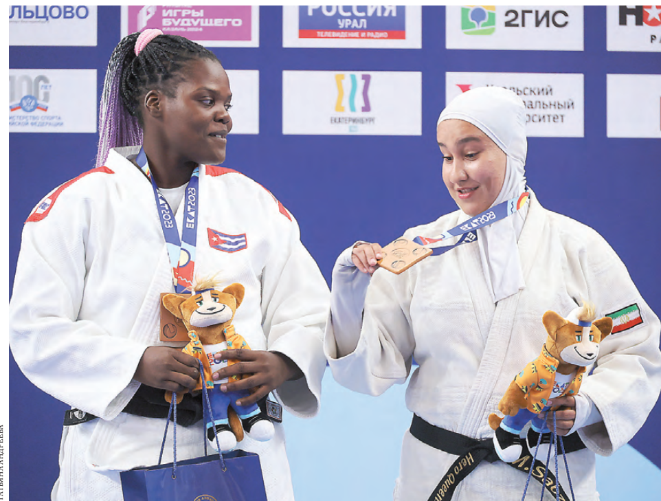
Участники фестиваля легко нашли общий язык.