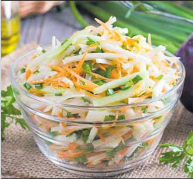
Салат из кольраби с морковью и огурцом

Морковь — богатый каротином и витамином А продукт, это знают все. Но кроме этого, морковь — богатейший источник калия, который положительно влияет на сосуды и сердечную мышцу. Регулярное употребление моркови нормализует работу ЖКТ — только не переусердствуйте, а то эффект будет более сильным, чем вы ожидаете. В общем, ешьте морковку, она полезная! Сегодня делимся с вами рецептами, в которых используется этот корнеплод. Источник рецептов и фото: телеграм-канал «Время есть».