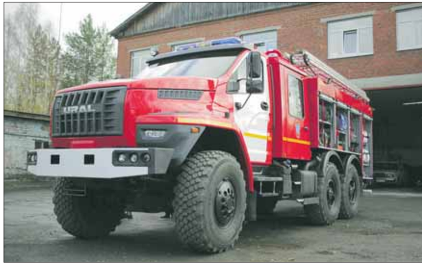
Габариты «УРАЛ NEXT» впечатляют: длина 8,6 метра, ширина 3,2 метра и высота 3,4 метра. Авто полноприводное, все шесть колес гребут землю одновременно — то есть это вездеход.