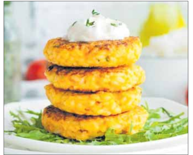
Морковные котлеты с рисом