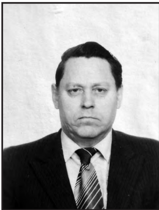
За свой труд неоднократно поощрялся благодарностями, Почетной Грамотой Главы Талицкого городского округа. Пользовался уважением коллег и жителей управы.