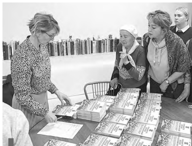
400 экземпляров брошюры разлетелись по библиотекам, школам и детским садам городского округа, пополнили домашние книжные полки