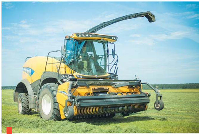
Уборочная техника на полях села Рудянского