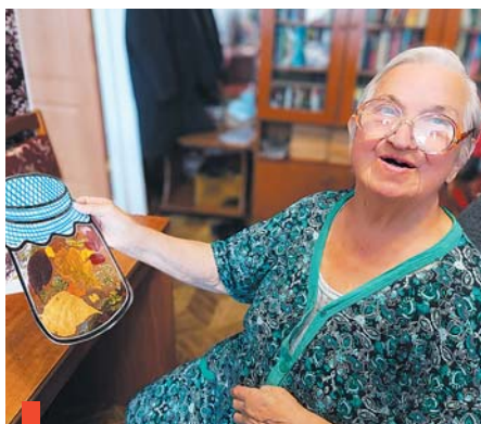
На мастер-классе «Век живи – век учишь»

Музыкальный концерт подготовило КСО «Гармония». Члены туристского клуба «Оптимисты» пока-