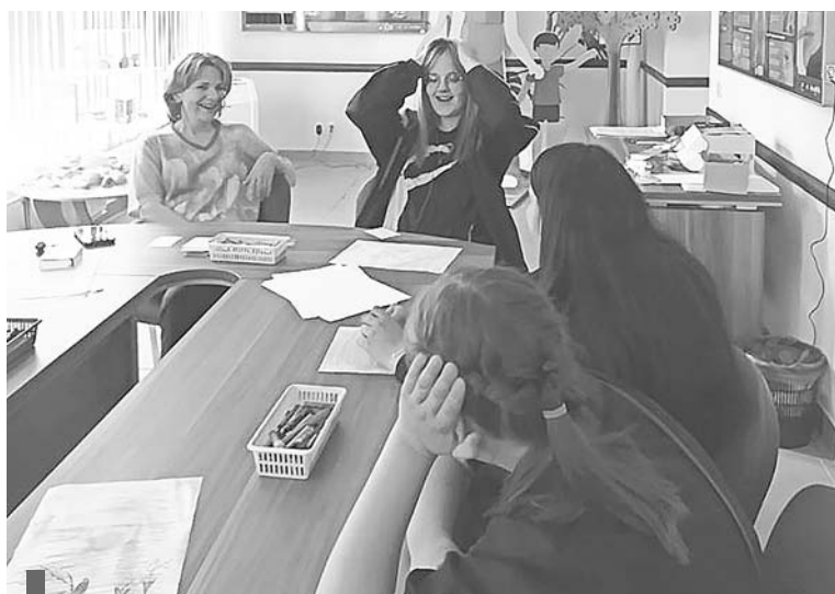
Умение понимать свои эмоции помогает сохранять здоровье

– По определению ВОЗ, в целом здоровье – это совокупность физического, психического и социального благополучия. Психика и тело состоят в неразрывной связи. Если мы заболели чем-то, наша психика обязательно реагирует. Если мы долго находимся в негативных эмоциях, мы заболеваем на физическом уровне. Если происходят какие-то события в социуме, конфликт, семейная проблема, которые не имеют экологичного выхода, тело на это также «ответит».